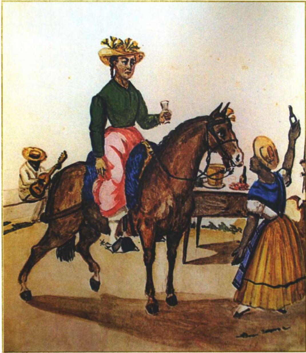
Mujer a caballo adornada con flores de Amancaes tomando chicha.