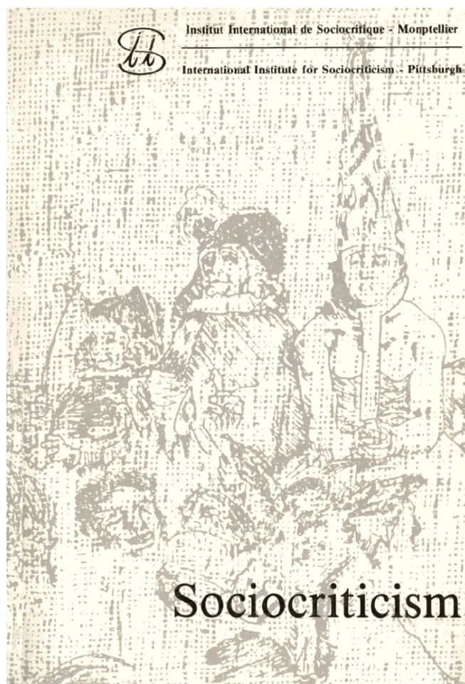
Ilustración 1: cubierta del número 1 de Sociocriticism (1985)