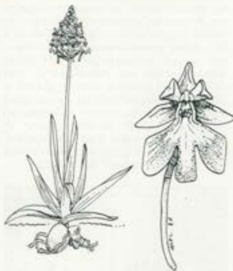
Anacamptis pyramidalis .