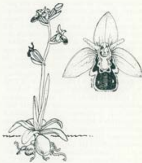
Ophrys apifera (Abellerà).

Amb la bonança del maig i juny s'obriran al Vallès les orquídies adormides. Durant l'hivern, només un bulb soterrat, per primavera una roseta de fulles, i prop de l'estiu, amb quatre dies es dreçarà una tija coronada d'aquestes petites i delicioses flors.