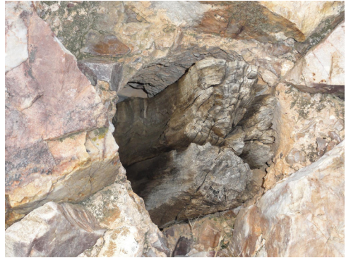
Fig. 6: Detalle de mechinal con madera.

Además en el año 2010 se realizó una investigación con metodología arqueológica, que entre otras actuaciones efectuó una completa excavación integral del interior del recinto (Benítez de Lugo, 2010). Los elementos materiales documentados se correspondieron con un número reducido de fragmentos de adobe y cerámica, significativamente más escasos todavía, perteneciente a la tipología definida como “común”. Otra intervención de carácter arqueológico permitió registrar documentalmente plantas y alzados, acción esta última realizada mediante escaneado tridimensional.