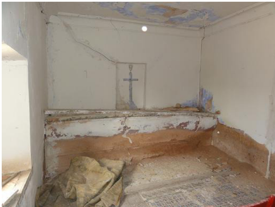
Fig. 3: Oratorio cortijo de los Baños de Cristo, a los pies de la fortificación.

Tomando este último documento como referencia, podemos señalar que en este complejo se construyó un oratorio o capilla consagrada al Cristo del Consuelo, en el que además se encontraba dibujada al fresco, sobre un fondo azul celeste, la imagen de un Cristo crucificado (Benítez de Lugo, Torres y Moraleda, 2012). Esta consagración acabó por dar nombre a la casa de baños, y ésta, por proximidad, a la atalaya medieval presente (Fig. 3).