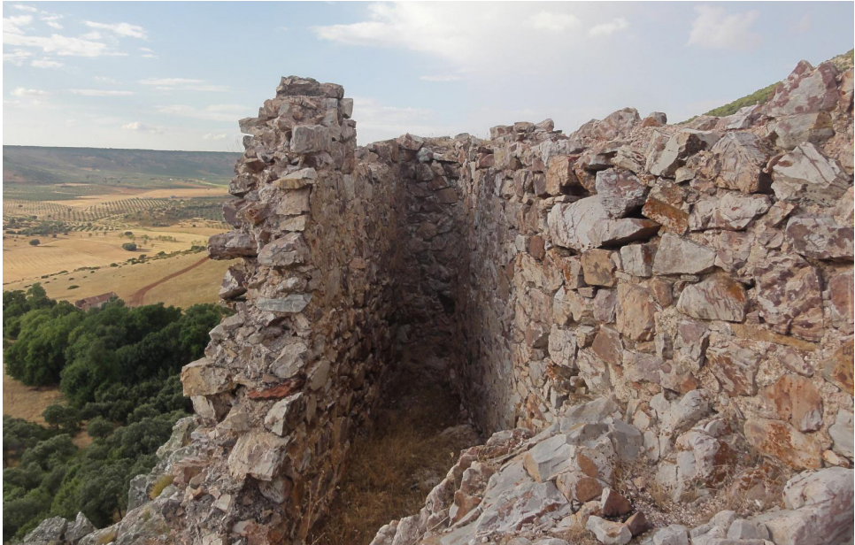
Fig. 4: Detalle del interior de la fortificación y muros meridional y occidental

Se encuentra a una altura de 900 metros sobre el nivel del mar, y a unos 200 metros sobre la vega del río Villanueva. Este emplazamiento estratégico le permite controlar visualmente un amplio valle que forma el río Villanueva junto con otros arroyos menores como Fuente de la Bola o Cañada de la Vieja.