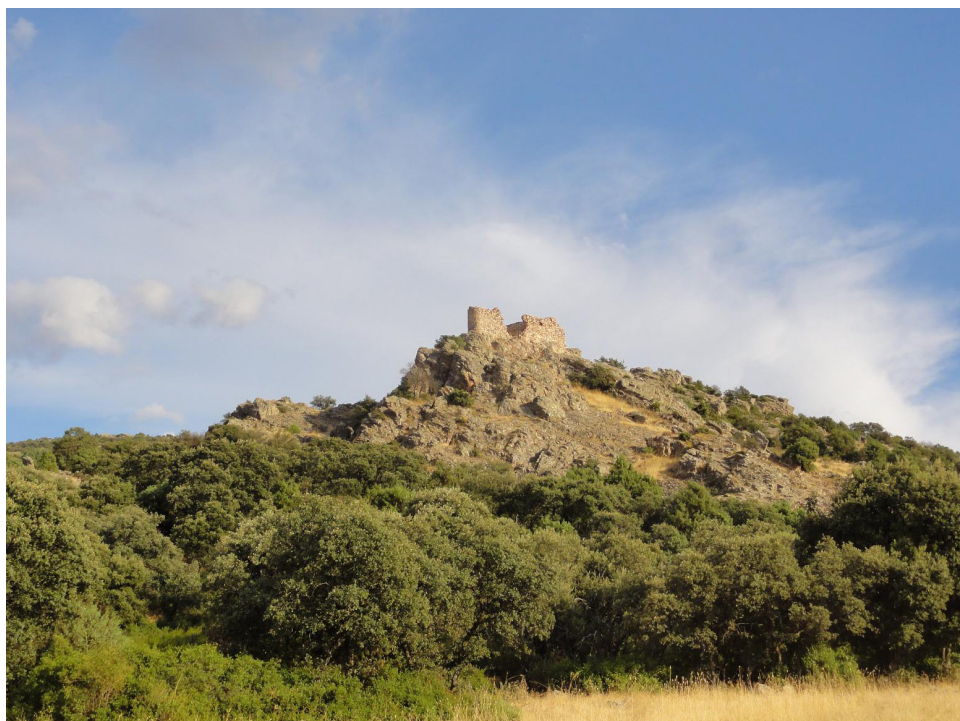
Fig. 1: Torre de los Baños de Cristo o del Santo Cristo.

En todo este escenario descrito del mundo bajomedieval montieleño hemos de situar la génesis de la torre o atalaya de los Baños de Cristo, dentro de una serie de construcciones de nuevo cuño que aparecieron tras el proceso de conquista castellana (Fig. 1).