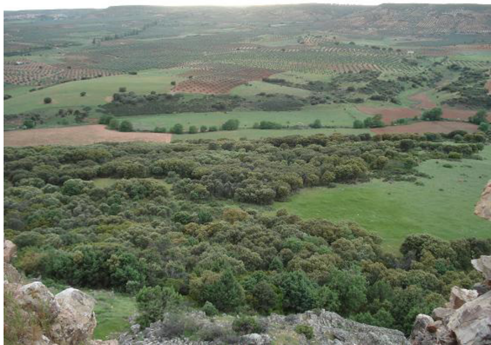
Fig. 5: Vista del valle del río Villanueva desde la torre.

De todos modos, a pesar de estas ventajas referidas, desde el punto de vista estratégico la atalaya presenta una serie de limitaciones que le confieren una singularidad particular.