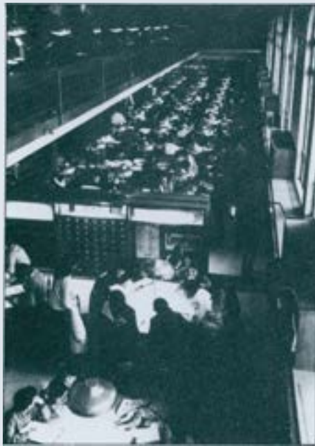
Biblioteca de la Caixa d'Estalvis de Sabadell. Vista parcial

Sota el guiatge del seu fundador fins al 1916 i, després, del doctor Lluís Car-