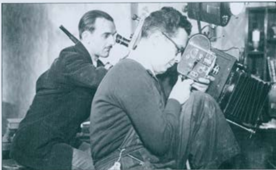
En el rodatge de VIDA EN SOMBRAS Llobet-Gràcia no pot resistir la temptació de filmar-ne una seqüència amb la seva càmera personal de petit format, mentre l'operador de l'equip treballa amb la gran.

Avui tenim un sabadellenc, Francesc Bellmunt, fent-se un nom en el camp del cinema català, on porta ja realitzats uns quants films que, amb la seva incidència en temes i tipus de molta mànega ampla, han produït un bon impacte d'acceptació sobretot entre el públic jove. Darrerament Bellmunt ha esdevingut cap del col·lectiu creat per la nova fornada de realitzadors que treballen per a la normalització d'una producció genuïnament catalana.