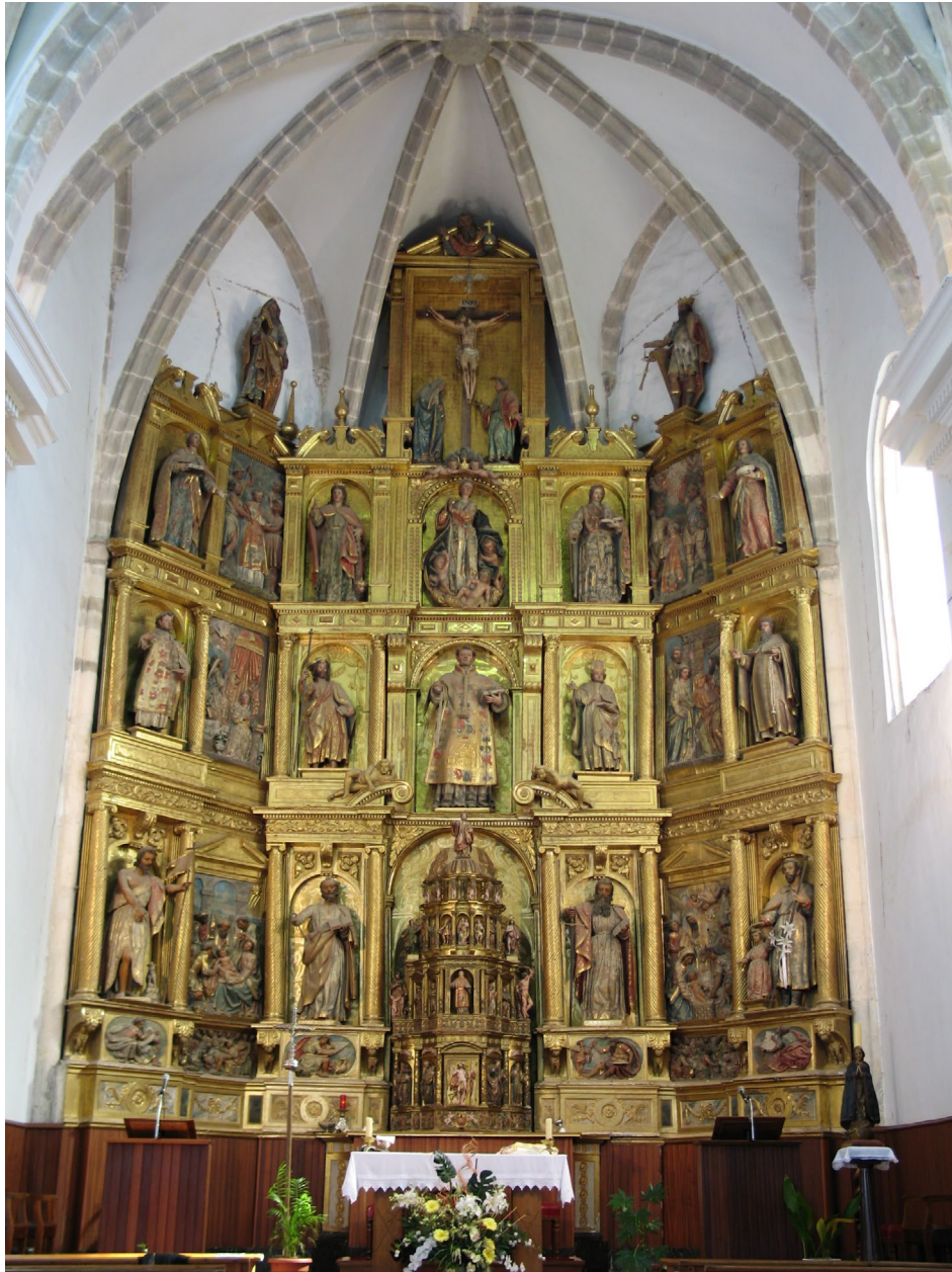
4. Cabecera de la parroquia de San Esteban de Zurbano (Álava), Pedro de Ayala, a partir de 1631