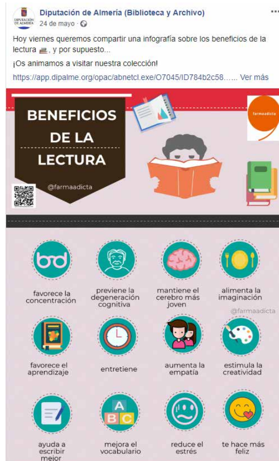
Ilustración 3- Post en Facebook 3

Un aspecto común a todas las publicaciones es el lenguaje cercano y la inclusión de las urls y enlaces para acceder directamente al catálogo de la biblioteca o al registro mencionado.