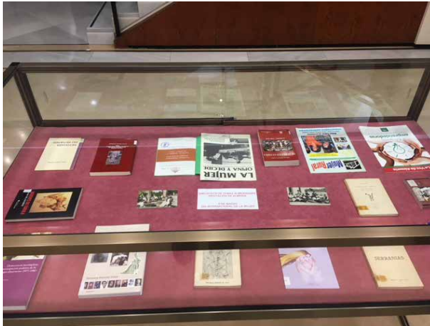
Ilustración 6- Vitrina 1. Exposición Día Internacional de las Mujeres

El 8 de marzo, para conmemorar el Día Internacional de las Mujeres, se seleccionaron monografías, artículos y revistas, de autoras almerienses, y postales de época de mujeres trabajadoras.