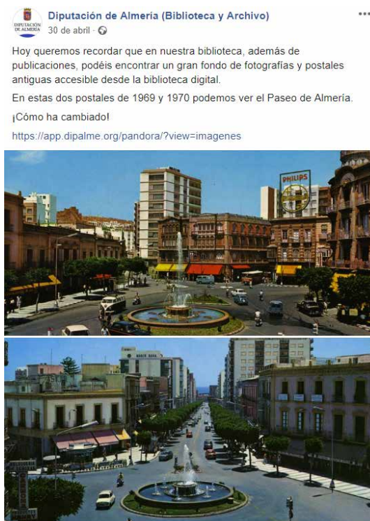
Ilustración 1- Post en Facebook 1

En la publicación se incluyen dos fotografías en las que se aprecia el cambio experimentado por la ciudad a lo largo del tiempo.