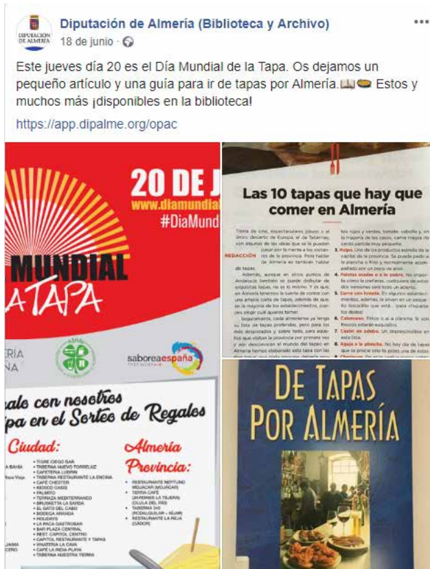
Ilustración 4- Post en Facebook 4

Actualmente, algunas bibliotecas digitales ofrecen su catálogo bibliográfico en un servidor OAI (Open Archives Initiative), accesible por medio del protocolo OAI-PMH, gracias al cual se pueden consultar las colecciones digitalizadas, no solo a través del propio catálogo de la biblioteca, sino también desde portal de acceso al patrimonio digital Hispana y desde la biblioteca digital Europea.