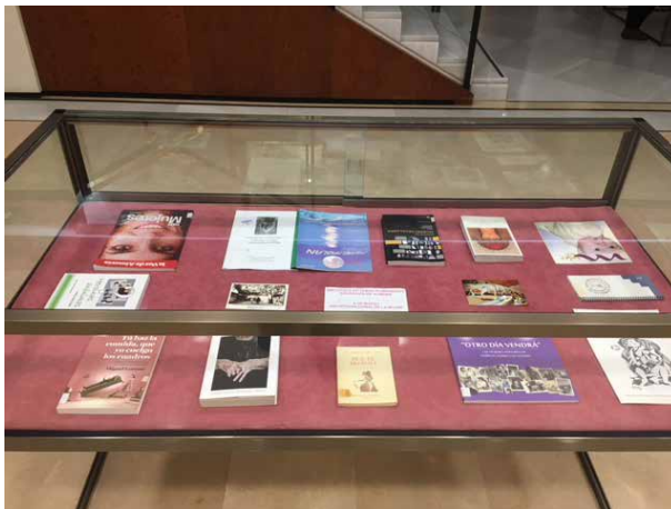
Ilustración 7- Vitrina 2. Exposición Día Internacional de las Mujeres