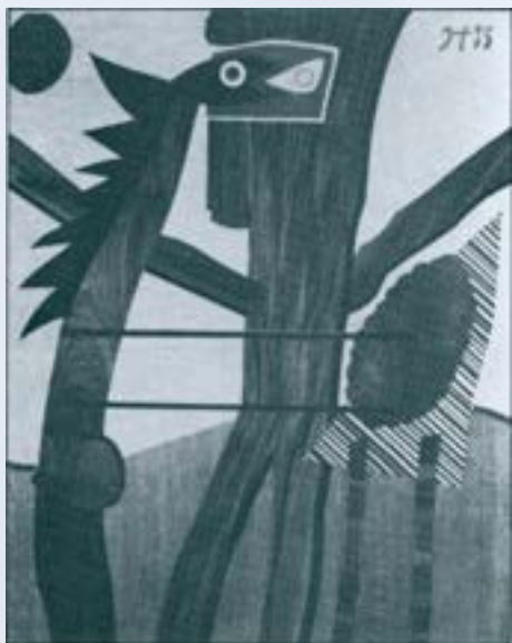
Marqueteria (135x105 cms.).