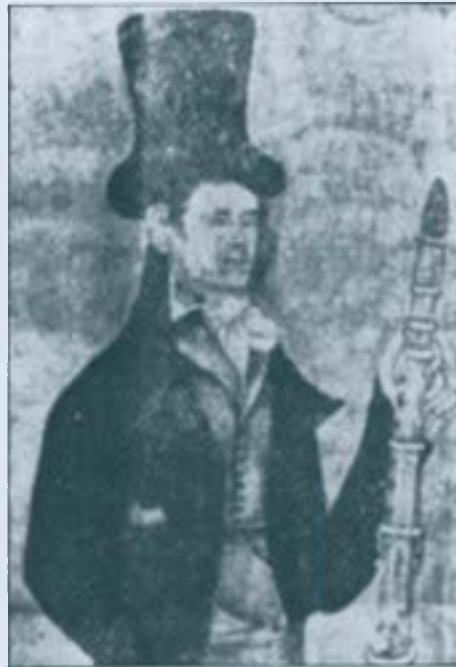
Fotografia d'un dibuix anònim reproduint la figura del fundador de la primitiva "COBLA MUIXINS" (1810).