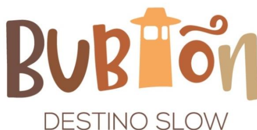
Figura 3. Logo Bubiión Destino Slow

Durante la elaboración del PLT las mesas de trabajo también participaron en el diseño de la marca turística, primero cumplimentando un cuestionario y después eligiendo la imagen definitiva y el eslogan del municipio. Esta nueva identidad estaba llamada a convertirse en una invitación para disfrutar del entorno natural, histórico, patrimonial y auténtico de forma calmada.