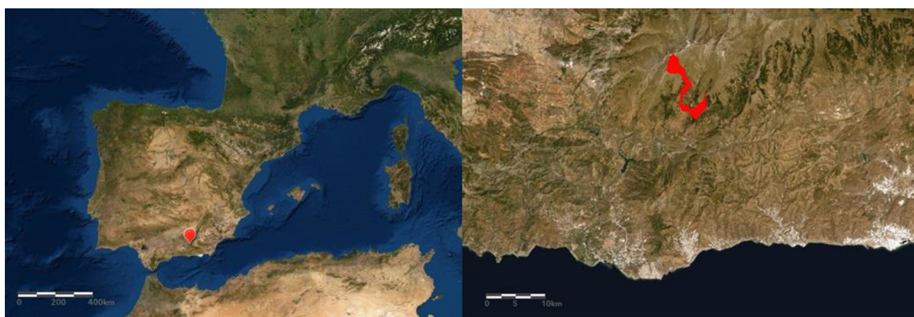
Figura 1. Localización de Bubión y su término municipal.

Bubión se sitúa en la provincia de Granada, en la comarca de La Alpujarra, concretamente en lo que se denomina La Alpujarra Alta. Pertenece a los pueblos del barranco de Poqueira. La catedrática de Historia medieval de la Universidad de Granada, Carmen Trillo, en un artículo sobre el poblamiento de las Alpujarras a la llegada de los cristianos, describió la Taha de Poqueira que actualmente componen Bubión, Capileira y Pampaneira (Trillo, 2009). Situada en la vertiente meridional de Sierra Nevada, Bubión se ubica entre Capileira y Pampaneira, a unos 1.300 metros de altitud 4 . Para concretar sus características me remitiré a la literatura clásica (Fontboté, 1957; Bosque Maurel, 1971; Rodríguez, 1985).