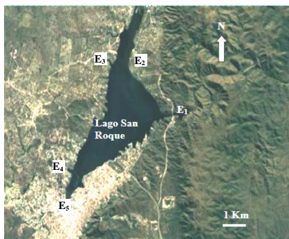
Figura 1. Fotografía satelital ubicando las estaciones de muestreo.

Se realizaron 8 muestreos estacionales, durante el período comprendido entre febrero 2014 a febrero 2016. Se aclara que no fue posible tomar muestras durante el verano de 2015, debido al exceso de precipitaciones, cuando ambos embalses superaron la cota de vertedero, incluso hasta comienzos del otoño. Se consideraron cinco estaciones de monitoreo y fueron ubicadas en el paredón del embalse y en la desembocadura de los tributarios. Estación E 1 : paredón de embalse San Roque; estación E 2 : desembocadura río Cosquín; estación E 3 : desembocadura arroyo Las Mojarras; estación E 4 : desembocadura arroyo Los Chorrillos y estación E 5 : desembocadura río San Antonio (Figura 1).