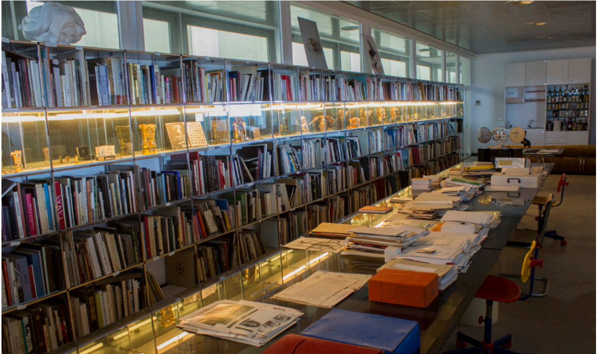
fig.01 Referencias / References

Estudio de Berrocal Villanueva de Algaidas (2019).