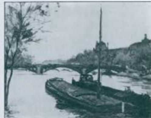
Pintura de Vila-Puig