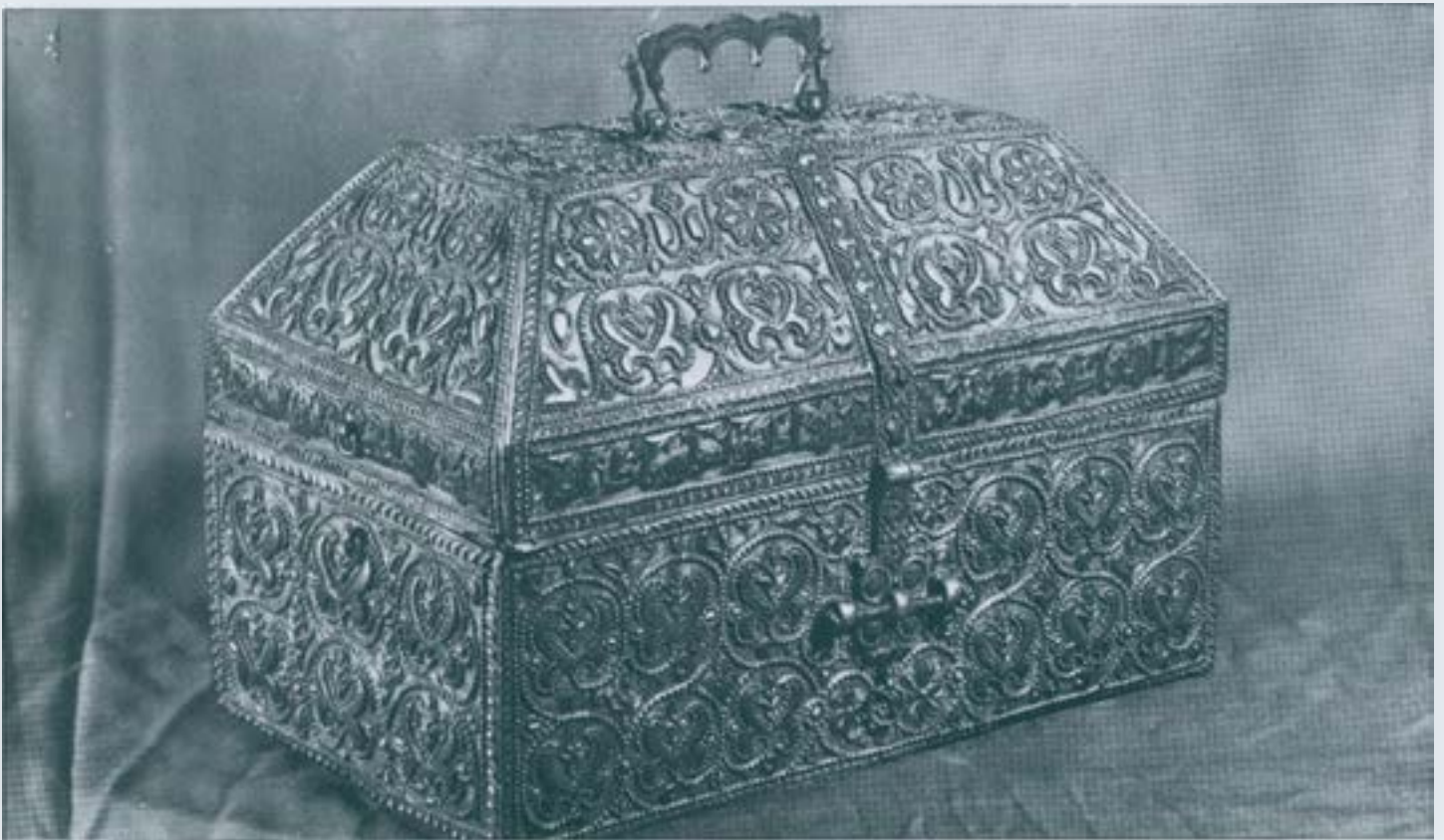
Catedral de Girona: Arqueta musulmana de plata d'Elxer II: probable fruit del botí de la incursió a Cordova de l'any 1010.

No podem renegar del nostre europeisme al que hem servit durant dotze segles d'una manera indefallent. I hem de reafirmar-nos en la nostra voluntat de que mai per mai l'Àfrica començarà als Pirineus.