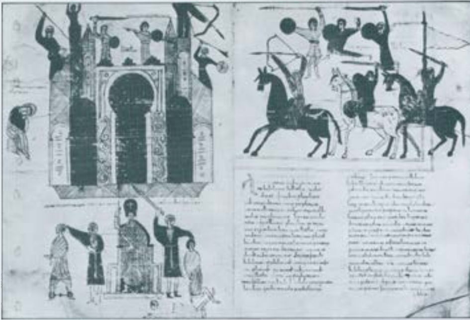
Beatus de la Seu d'Urgell: Setge de Jerusalem per Nabucodonosor. A la presa de Barcelona per Almansur hi devien ocórrer escenes semblants.

ria de la formació de Catalunya, ni que fós abreujadament. El que sí pretenem és recordar i reafirmar aquest nostre europeisme en uns moments en què, amb diversos pretextos, sembla que es