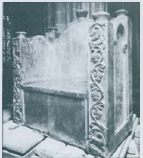
La Cadira de Carlemany.