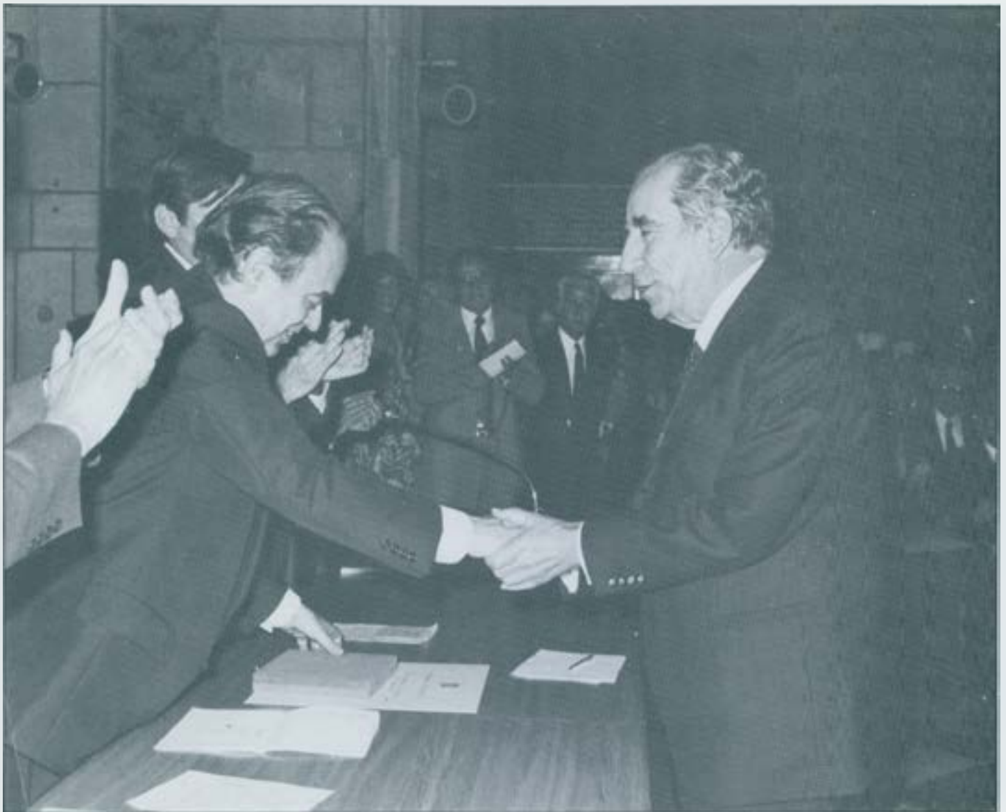
Concessió de la Creu de Sant Jordi de la Generalitat de Catalunya (15 juny 1982).