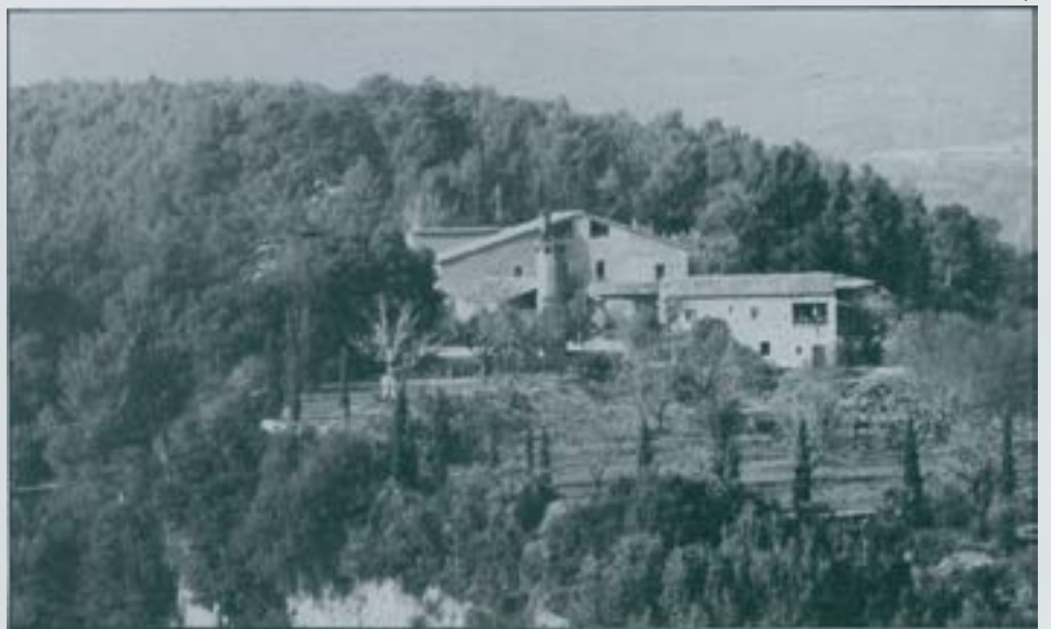
La Masia de Can Deu, envoltada del seu bosc.