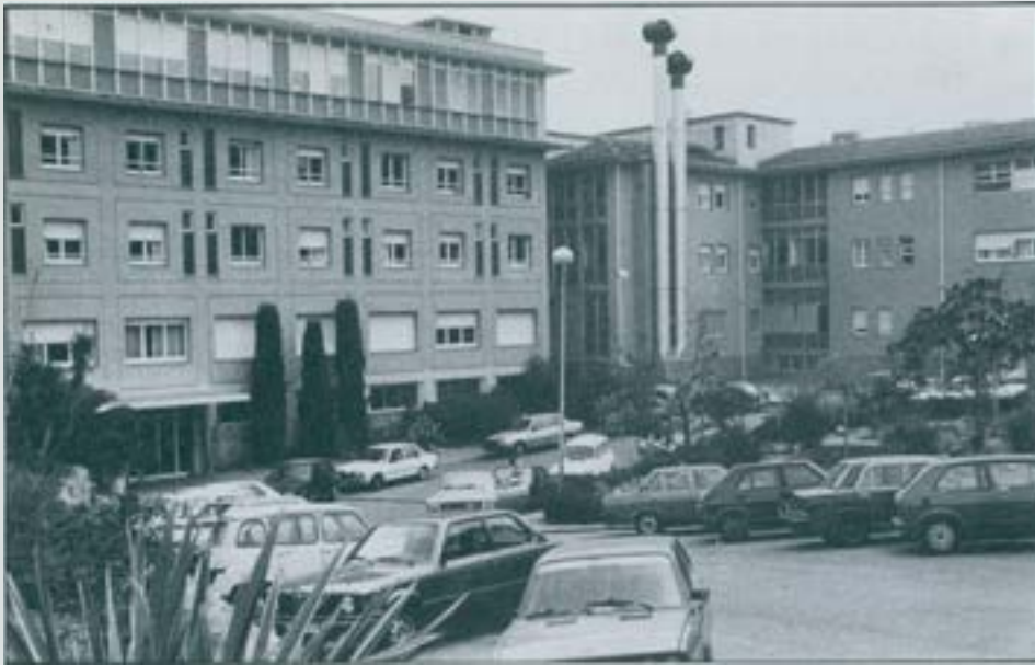
Clinica Infantil Nen Jesús.