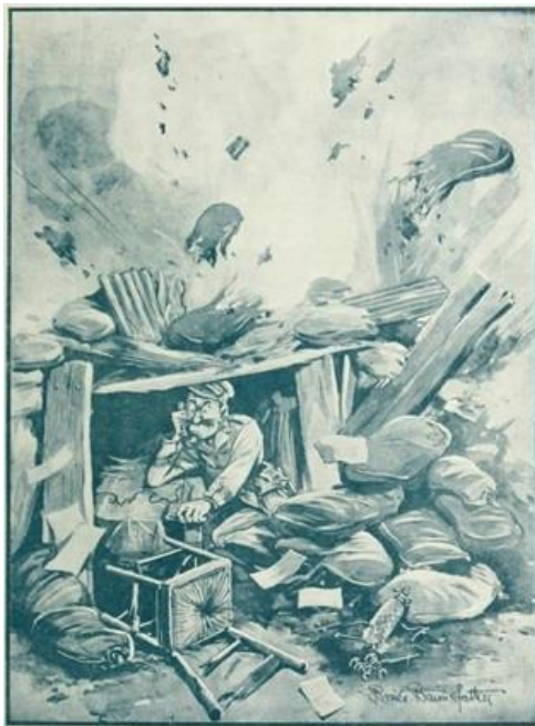
The Things that Matter.

Sería otro británico, Bruce Bairnsfather, cuya obra se publicaba en The Bystander , el más famoso dibujante durante la Gran Guerra. The Bystander circuló profusamente entre la tropa a pesar de la resistencia inicial del Parlamento, que describió sus dibujos como “ vulgares caricaturas de nuestros héroes ”, pero finalmente terminó imponiéndose su popularidad y sus personajes, en particular el capitán Old Bill – un oficial gruñón pero tenaz – conquistaron tanto a la tropa como a la población civil, por su mezcla de ironía y realismo con la voluntad de resistir del pueblo. Su propia experiencia en las trincheras se refleja en sus viñetas, que nos muestra unos Tommies 19 descontentos pero, como su Old Bill , estoicos ante los bombardeos que sufrían constantemente. Ya durante la Segunda Guerra Mundial