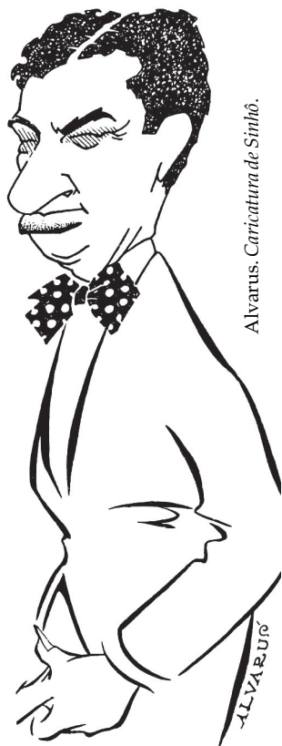
Alvarus. Caricatura de Sinhô.

Essa síntese da brasilidade é vista com reservas, pois resultaria numa excessiva flexibilização de valores, a ponto de comprometê-la eticamente.