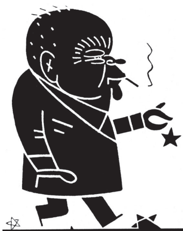
Caricatura de Orestes Barbosa.

Esses diferentes balizamentos da linguagem, revelando distintas inserções sociais, são particularmente agudizados nas sociedades modernas nos momentos em que se busca fixar a língua nacional. O processo através do qual essa língua passa a ser considerada oficial, única e legítima, é necessariamente conflituoso, em meio à luta social pela atribuição de sentidos das palavras. O contexto de 1900-1920 é especialmente rico, numa conjuntura em que ocorreram as comemorações do quarto centenário da descoberta do Brasil e, posteriormente, do centenário da independência. São nesses momentos que costumam ser realizados balanços da nacionalidade, assumindo a linguagem, aí, papel de destaque. Em 1922, Antenor Nascentes publicou O linguajar carioca 6 , Raul Pederneiras, a Geringonça carioca: verbetes para um dicionário da gíria 7 e Orestes Barbosa registrou a gíria dos malandros cariocas.