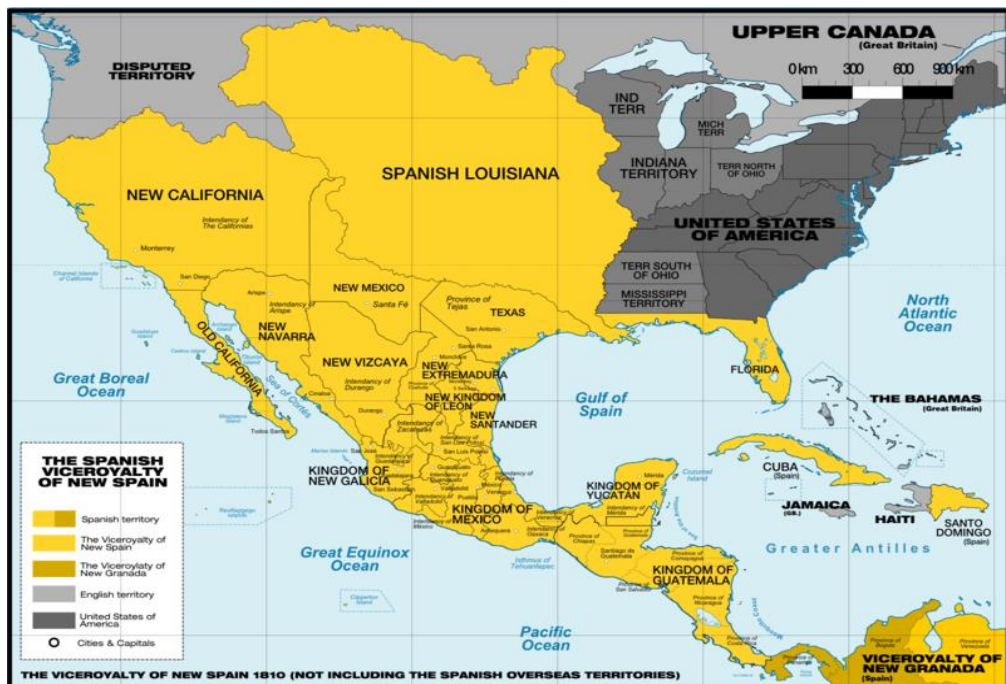
Mapa de Norteamérica en 1800, en amarillo los territorios que comprendían el Virreinato de Nueva España.

La cesión de España de la Isla de Puerto Rico tras la guerra hispano-estadounidense de 1898, no hizo que el idioma español desapareciera a pesar de los intentos por parte del gobierno federal estadounidense debido a la resistencia puertorriqueña en defensa del idioma como parte de su cultura. Actualmente Puerto Rico es un “territorio que pertenece a EEUU pero no es parte” según el Tribunal Supremo de los EEUU, no obstante los puertorriqueños (5 millones en EEUU y 3.6 millones en Puerto Rico aproximadamente 9 ) son ciudadanos estadounidenses desde 1917. En 2016 se cumplirán 118 años de una cesión obligada que no ha estado exenta de tensiones políticas a nivel local y que sigue marcando la política respecto a las relaciones constitucionales entre Puerto Rico y los EEUU. Por otro lado, la emigración mexicana durante el Siglo XX e inicios del Siglo XXI por su cercanía a los EEUU han llevado a este grupo ser el más numeroso dentro de la comunidad hispana representando cerca de 34.6 millones de personas a nivel nacional, un 10,9% de la población total de los EEUU 10 . Por último, otro grupo importante de la comunidad hispana son los cubano-