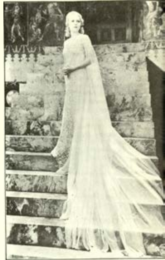
THE TAMING OF THE SHREW, 1929, Sam Taylor. Pel·lícula sonora. "Little Mary" s'ha acabat

Mary Pickford, que havia començat a treballar en el teatre als cinc anys (com tants d'altres!), es deia Mary Gladys Smith i havia nascut a Toronto (Canadà) l'any 1893. El cognom Pickford era el del seu avi matern.