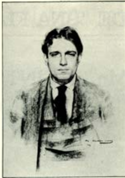
Eugeni d'Ors, per Ramon Casas

Ja s'ha fet constar que el "Glossari" reneix al diari "ABC", ara amb el nom de "Nuevo Glossario", com seguirà anys després sota la rúbrica de "Novísimo Glossario" en altres periòdics. Al cap de pocs anys d'arribar a Madrid, d'Ors és elegit membre de l'Acadèmia de la Llengua, com més tard ho serà de la de la Història; segueix viatjant per Europa i l'esclat de la guerra civil espanyola el sorprèn a París, des d'on opta per passar a l'Espanya nacional, que l'acull