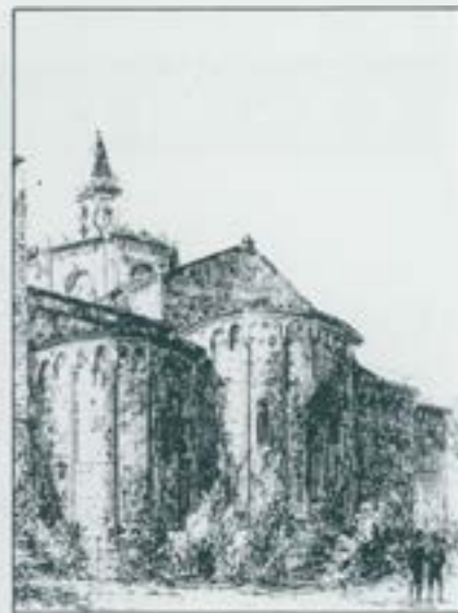
Gravat de l'excursió del 24 d'agost de 1879.