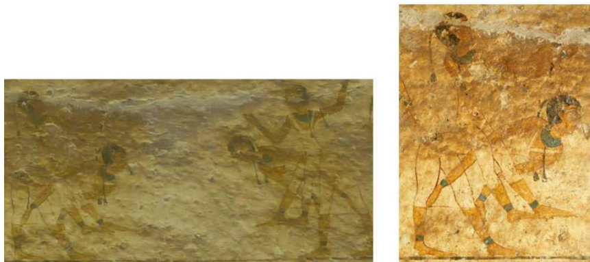
Figura 4. Tumba nº 17 de Beni Hassan, perteneciente a Khety.