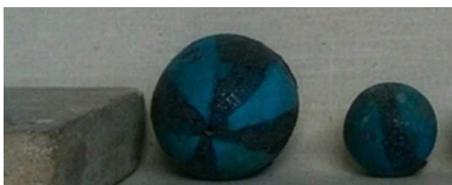
Figura 9. Pelota. Museo del Cairo.

En el segundo piso del Museo Egipcio (El Cairo), en el pasillo que conduce a la exhibición de los objetos funerarios encontrados en la tumba del niño Faraón Tutankamón, hay algunos juguetes reales egipcios antiguos muy interesantes.