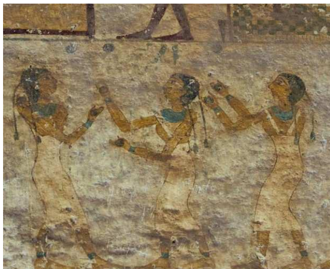
Figura 2. Tumba n° 17 de Beni Hassan, perteneciente a Khety.