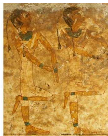
Figura 8. Tumba n° 17 de Beni Hasan, perteneciente a Khety.

Esta actividad se consideraba, como vemos por el traje de los artistas intérpretes o ejecutantes, como una variedad de un tipo de baile. En la escena vemos jugar con varias pelotas a la vez, o atrapar dos pelotas con los brazos cruzados y con todo tipo de posiciones curiosas durante juego...se paran sobre una pierna, saltan alto en el aire (Erman, 1894).