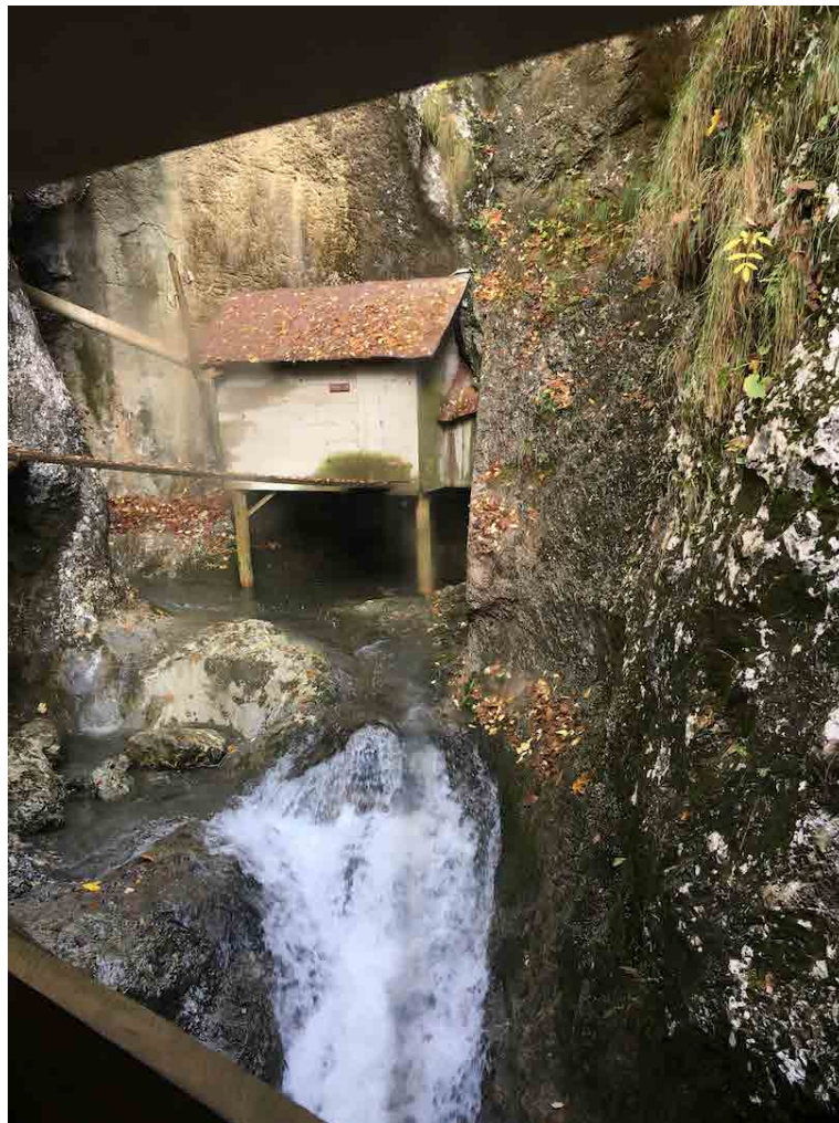
Imagen: Memorial-Museo del Hospital de Partisanos de Franja, Eslovenia.

su recuperación, restauración y recreación museográfica como patrimonio, natural, local y memorial.