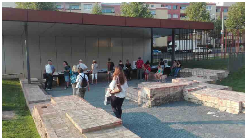
Imagen de la parte de la visita del Memorial del Muro de Berlín, recuperación de restos arqueológicos y espacio de información e interpretación, así como podemos ver una parte de reinterpretación en barros de hierro corten del propio muro.