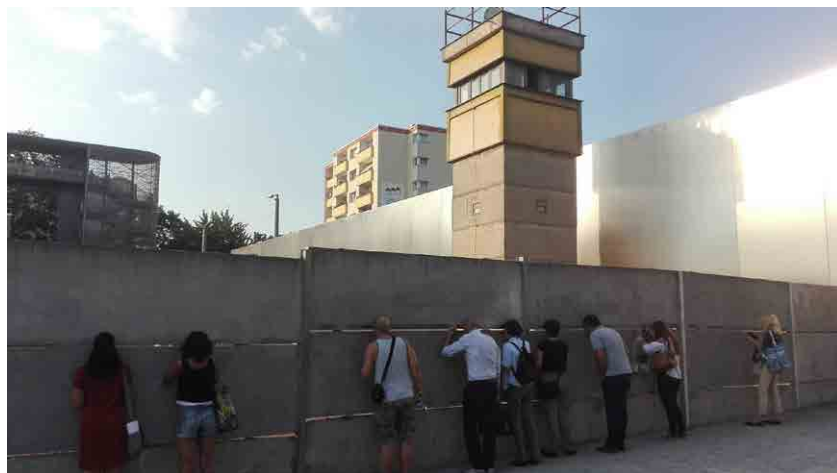
Imagen de la torre de vigilancia y espacios originales del Memorial del Muro de Berlín. La amalgama de sistemas de reinterpretación y transmisión consiguen un aprendizaje positivo.