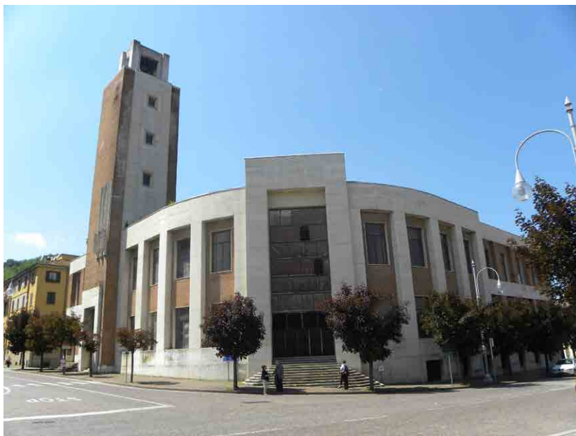
Imagen: Casa del Fascio en Predappio. Edificio donde se debe ubicar el nuevo Museo Memorial sobre el Fascismo.

Predappio está pues en medio de la polémica, algunos comienzan a defender que se haga derruir la casa del Fascio y se olvide el proyecto. Tal vez, hacerlo sería dar la razón a aquellos que ya tienen su lugar físico y simbólico de peregrinación en Predappio y se les concedería la exclusiva. Tienen la casa museo y tienen el panteón privado. Quizás que el resto de ciudadanos podamos disponer pronto de un espacio de aprendizaje, reflexión y análisis crítico de lo que fue uno de los orígenes de las catástrofes del siglo XX, pero la política y sus derivas sentenciarán, una vez más, a ese lugar a la polémica constante.