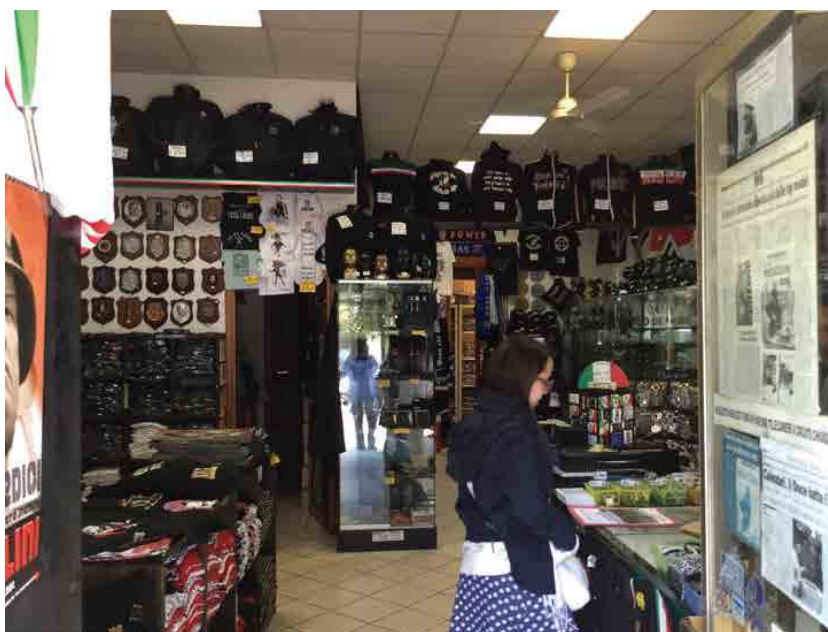
Imagen: Tienda de «souvenirs» nazifascistas en Predappio.