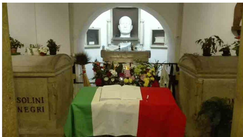
Imagen: Cripta y tumba de Benito Mussolini y su familia.