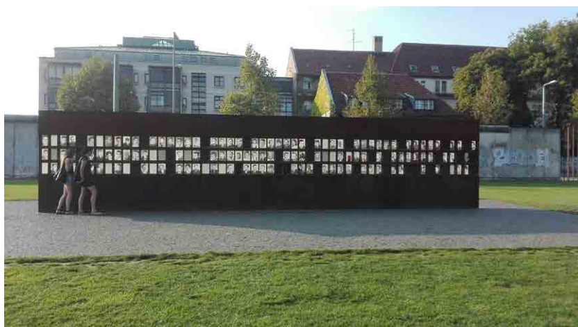
Imagen del espacio de interpretación del Memorial del Muro de Berlín dedicado a los testimonios y las víctimas.