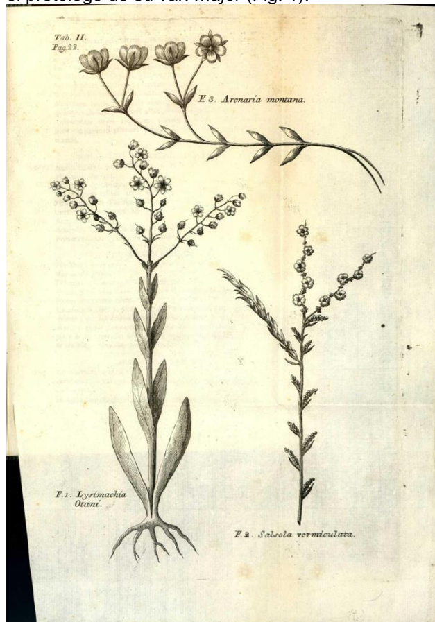
Figura 1. Lectotypus de Arenaria montana var. major Boiss. Icono Synopsis stirpium indigenarum Aragoniae . (1779) tabl.2, fig. 3.

mo de la subsp. montana , de la que sería sinónimo heterotípico. La var. major , está sin tipificar (Burdet et al. , 1983), nosotros tampoco hemos encontrado material adjudicable al protólogo en otros herbarios de referencia como K, MPU, o P (acrónimos según Thiers, 2020). Proponemos entonces como lectótipo la iconografía de Asso (1779) elegida por Boissier en el protólogo de su var. major (Fig. 1).