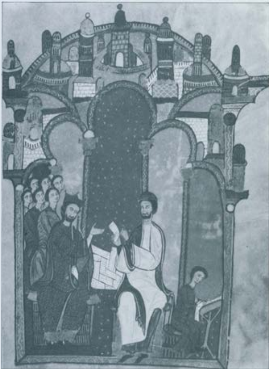
Ramon de Caldes, davant del rei Alfons I, revisa les escriptures que el copista transcriu al "Liber feudorum Major" (fóli 1).

A Catalunya tenim, entre els més antics, el "Liber feudorum Major" (compilat a instàncies del rei Alfons I per Ramon de Caldes a la segona meitat del segle XIIè) i el "Liber feudorum Ceritaniae", coetani de l'anterior. Tant l'un com l'altre estan decorats amb miniatures que, normal-