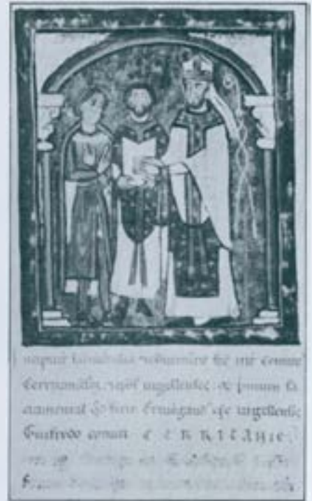
Sant Ermengol, bisbe d'Urgell, jura fidelitat al comte de Cerdanya Guifré. "Liber feudorum Cerdaniae", foli 17 v.