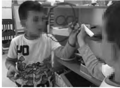
Imatges 8, 9 Dinàmica «Emocions al mirall»