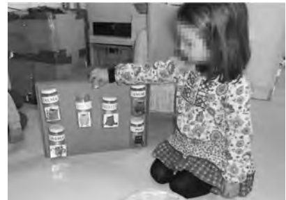
Imatge 5 Capsa de les emocions

Cada dia es mira quantes bolletes de cada emoció hi ha i a final de mes elaborem un «emocionòmetre» per veure l'estat d'ànim general de la classe i reflexionem sobre això. Això es pot fer per nin i/o de tota la classe i dona informació molt valuosa.