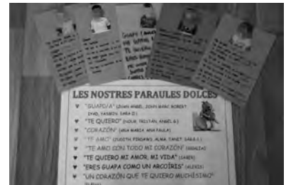
Imatges 15, 16

Dinàmica «Paraules dolces per als nostres companys»