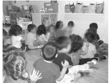
Imatges 10, 11, 12 Propostes per a la relaxació