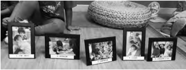
Imatge 14 Normes de convivència