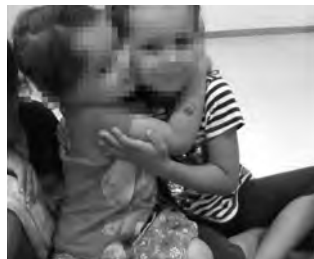
Imatges 17, 18 Dinàmica «La mascota de classe»