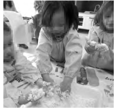
Imatges 23, 24, 25

Propostes per treballar les competències per a la vida i el benestar