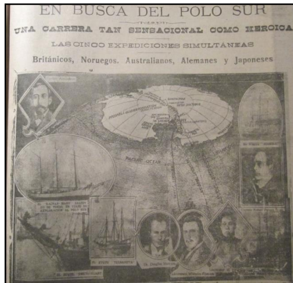
Fuente: Diario La Unión de Valparaíso (sábado, 16 marzo 1912), p. 9.