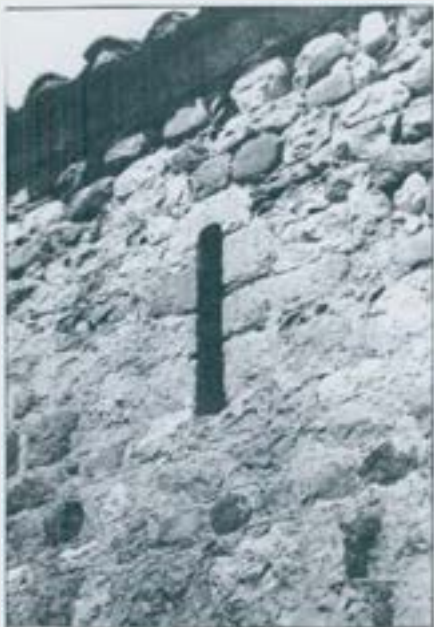
Finestra de la façana sud.

posar a algú si el nom d'“Antiga” no seria un adjectiu aplicat al culte a la Mare de Déu, sinó que tindria un altre origen. No creiem versemblant aquesta hipòtesi. Al nostre entendre res no vol dir que els senyors del castell de Santiga es diguessin d'Antiga: ¿és que nosaltres, correntment, no parlem d'un monjo de Montserrat, o de la campana i l'olla de Núria, o de