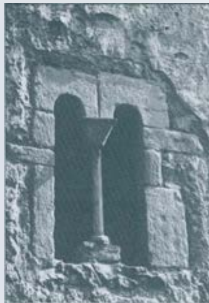
Finestra de la façana de ponent.

La devoció a Santa Maria Antiga era molt difosa al Vallès. Fins fa poc era bastant corrent entre les dones de