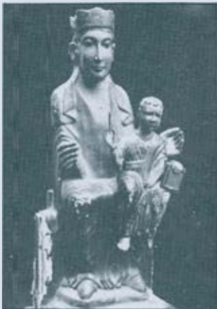
Imatge de la Mare de Déu, desapareguda.

Veiem doncs, que ara fa mil anys, l'església de Santiga es coneixia per Santa Maria Antiga . Això vol dir que ja en aquells temps no es tenia recordança de la seva erecció, donat que havia tingut lloc en un remot passat, en l'antigor. Per això l'església es