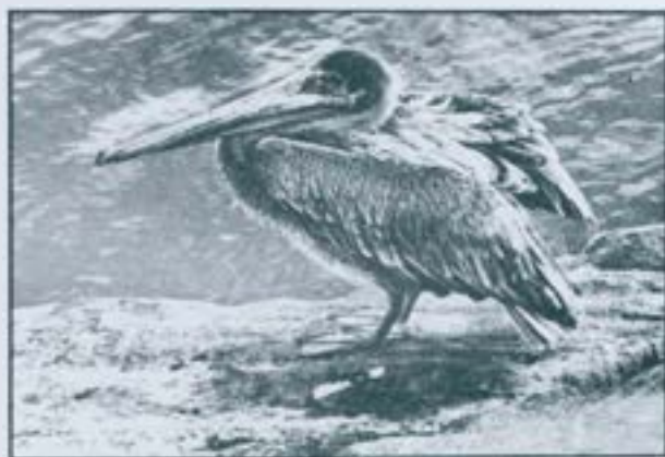
Malgrat que estem en època d'eleccions municipals, aquesta au no obra el bec...