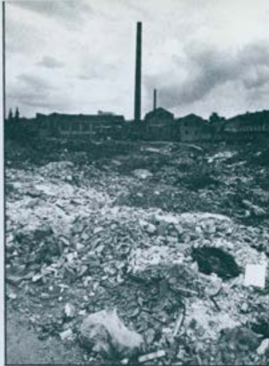
Heus ací una estampa sabadellenca. Naus industrials... Xemeneies que no fumegen... I a primer terme, runa i deixes. Ah! i entremig, un paper blanc. (Tal volta és un missatge esperançador...)