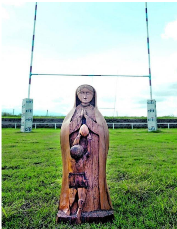
FIGURA 1 | La virgen del rugby