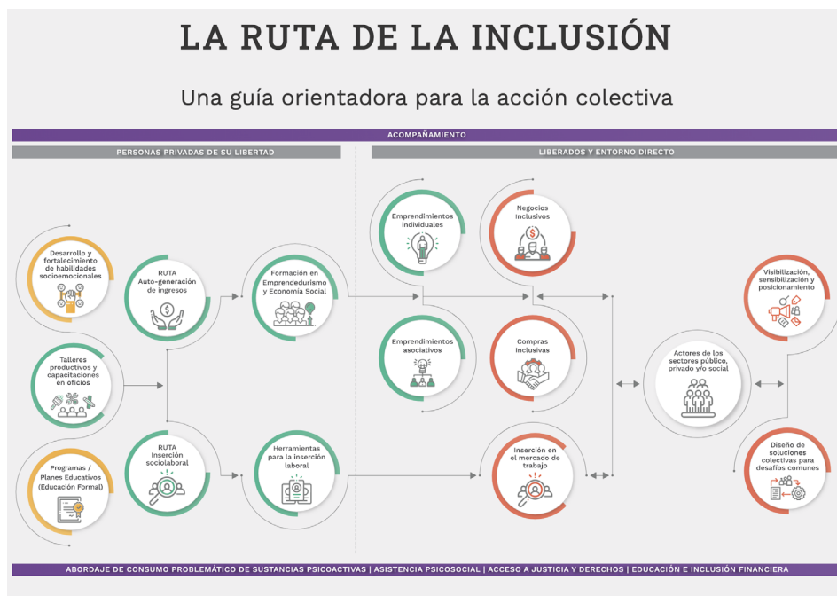
FIGURA 3 | Presentación institucional de LR

El desarrollo de capacidades busca brindar herramientas teórico-prácticas que posibiliten ampliar el espectro de oportunidades presentes y futuras de la población carcelaria y su entorno directo a través del desarrollo y fortalecimiento de habilidades socioemocionales, capacitaciones en oficios y programas educativos. En cuanto al desarrollo económico, LR se orienta a brindar herramientas y fortalecer capacidades específicas para la inserción económica de las personas detenidas, liberados y sus familiares a través de la inserción laboral en el mercado de trabajo o mediante los emprendimientos individuales o asociativos.