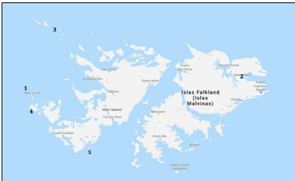
FIGURA 1 ARCHIPIÉLAGO DE LAS MALVINAS/FALKLAND

1 isla New/Goicoechea, 2 Puerto Soledad/Louis, 3 grupo islas Sebalde/Jason, 4 isla Beaver/San Rafael, 5 islotes franceses/ islas Arch