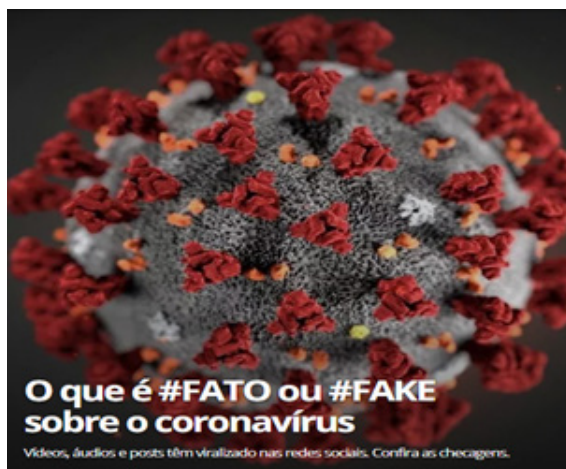
Figura 2- Print da sessão sobre coronavírus no Fato ou Fake

Trazendo essa preocupação para o contexto da pandemia do novo coronavírus e o rápido aumento dos casos de notícias falsas, o projeto Fato ou Fake passou a disponibilizar uma sessão exclusiva para a checagem e publicação de informações relacionadas à doença. Desde o dia 03 de fevereiro de 2020, quando a primeira notícia falsa sobre o coronavírus foi verificada, o portal tem publicado diariamente, vídeos, fotos e posts que tem viralizado nas redes sociais.