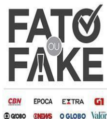
Figura 1 - Apresentação visual do Fato ou Fake

O projeto traz a transparência de informações como principal critério de checagem, e para isso serão consideradas: a transparência de fontes, na qual será apresentado, com clareza, o caminho de apuração percorrido pelo jornalista. Dessa forma, todas as fontes consultadas, pessoas ou instituições, serão identificadas nos textos; a transparência de metodologia, que deixará claro o processo de seleção da mensagem a ser checada, a apuração e a classificação da checagem, mostrando, assim, o porquê de tal notícia ser considerada fato ou fake ; e a transparência de correções, que irá identificar na reportagem se houver alguma alteração na checagem que tenha comprometido a publicação original. Abaixo a apresentação visual da seção: