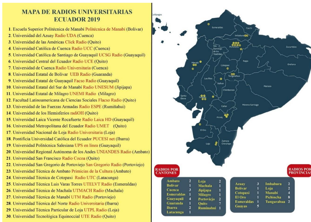
Figura 2: Mapa de Radios Universitarias en Ecuador 2019