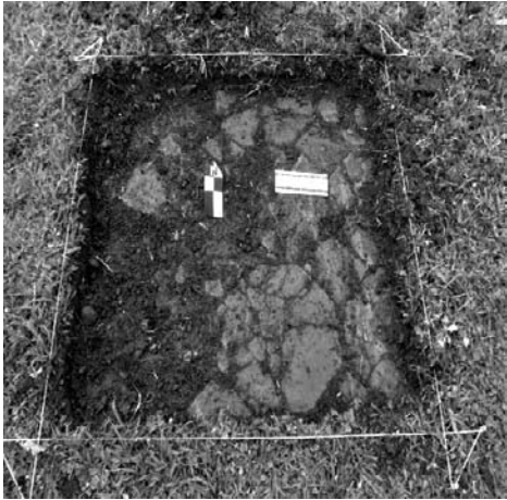
Figura 9. Piso de baldosas encontrado en el sondeo del sitio Concepción 5. Figura

por unanimidad, presentan un saber de que esta región estaba conformada por antiguas reducciones jesuíticas. En algunos casos se habla de Concepción como “la reducción más antigua de la provincia”.