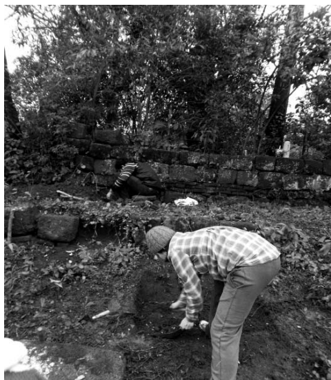
Figura 11. Trabajos de sondeos arqueológicos, en el sitio CONCEP 1.