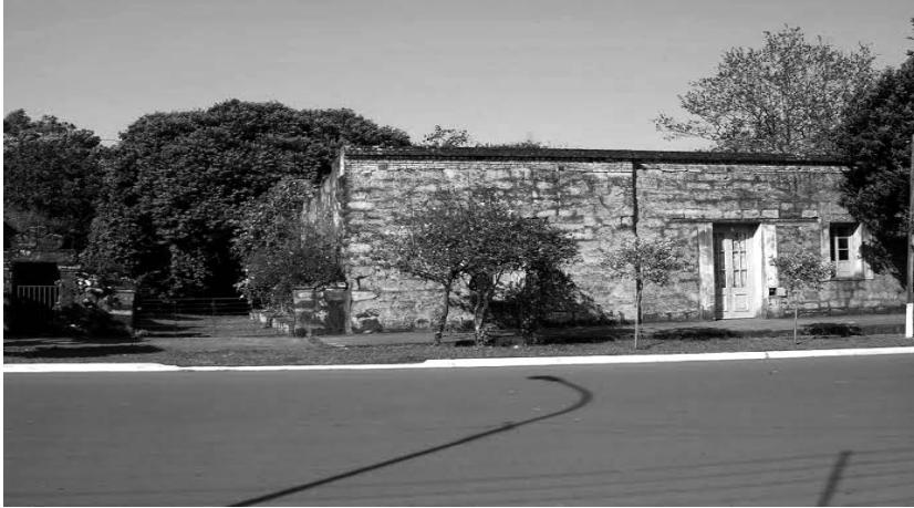
Figura 5. Antiguo cabildo actual propiedad de Márquez Noguera.

primera aproximación a los materiales que se encuentran a nivel del suelo (Figuras 9 y 10).