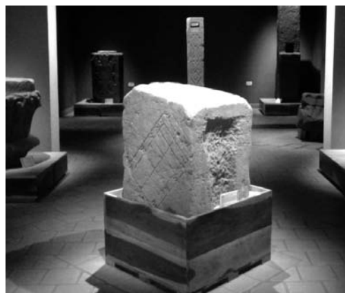
Figura 4. Materiales arqueológicos expuestos en la Casa de la Cultura, Concepción de la Sierra, Misiones.

En tercer lugar, y en base a los trabajos arqueológicos desarrollados por nuestro equipo de investigación, encontramos distintos materiales como fragmentos cerámicos, loza, vidrio, y restos de piso octogonal, provenientes de los primeros sondeos realizados, formando parte de una etapa exploratoria; es decir, una