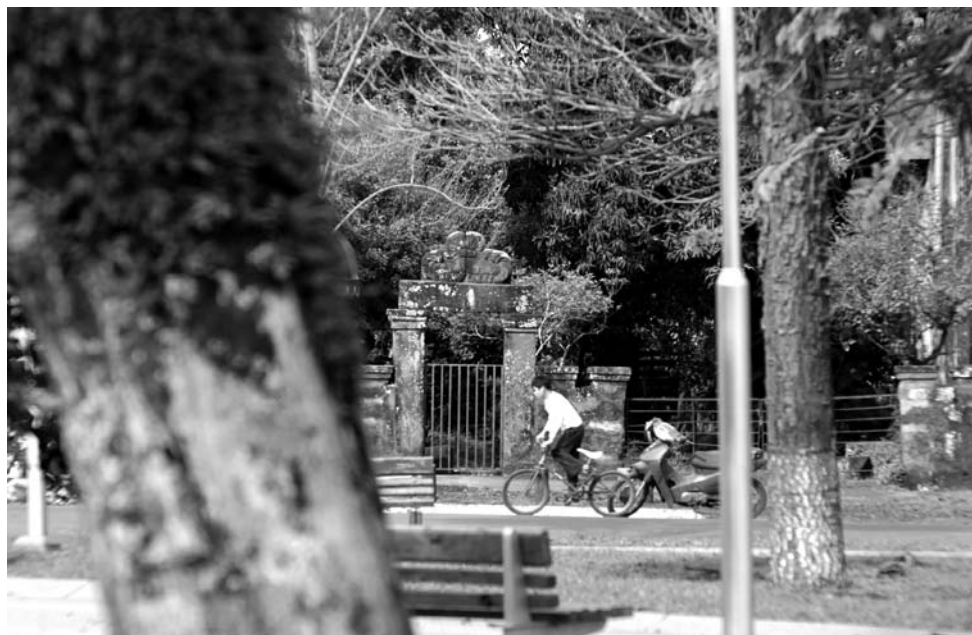
Figura 1. Calle del casco histórico de Concepción de la Sierra.

de los ríos Paraná, Paraguay y Uruguay. Estos acontecimientos implicaron "... cambios en los sistemas socioculturales aborígenes y en los comportamientos de los actores jesuitas directos, a través de la labor de las Misiones Guaraní-Jesuíticas..." (Capparelli 2011:51). Sin embargo, la reducción no pretendía ser una organización económica o una protección política. Para los jesuitas era una misión y una doctrina que llamaba a la conversión (Meliá 1993).