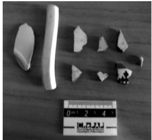
Figura 10. Fragmentos de mayólica, extraídos de los sondeos arqueológicos realizados en la manzana del cabildo.

Desde un punto de vista metodológico, lo que intentamos en estos primeros trabajos de excavación es observar los efectos de los procesos postdeposicionales. Estos son importantes para comprender la visibilidad, variabilidad, densidad e integridad del registro arqueológico (Lallami et al. 2011), teniendo en cuenta las características de los sitios tales como estar en ambientes selváticos con fuertes períodos de humedad, y al mismo tiempo ubicarse en lugares reutilizados que presentan un alto porcentaje de perturbación antrópica.