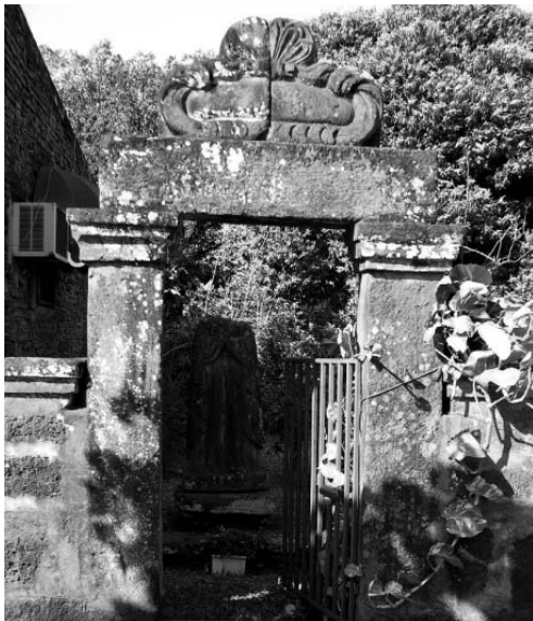
Figura 6. Pórtico con dintel monolítico. Ambos vestigios ubicados frente a la plaza principal.

A partir de esta comunicación pudimos aproximarnos también al conocimiento general por parte de la comunidad en relación a la materialidad arqueológica presente en su contexto social actual e histórico. Si bien no se