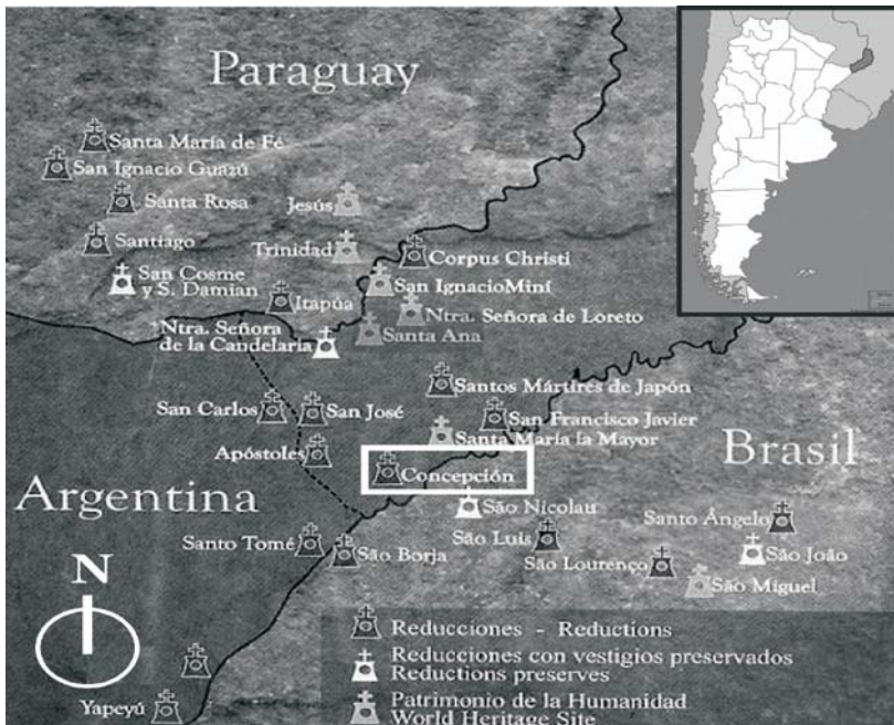
Figura 2. Ubicación geográfica de la reducción de “Nuestra señora de Concepción” en la región de las misiones jesuíticas ( www.misiones-jesuisticas.com.ar ).

La reducción de Concepción fue una de las más grandes y de ella surgieron los pueblos jesuíticos de San Nicolás y Santo Angelo, actualmente en territorio brasileño. Sin embargo, “...a pesar de haber sido madre de otras dos reducciones, Concepción contó siempre con numerosos pobladores. Así en 1702, la cifra fue la mayor de entre todas las reducciones de entonces, alcanzó 5653 habitantes”.