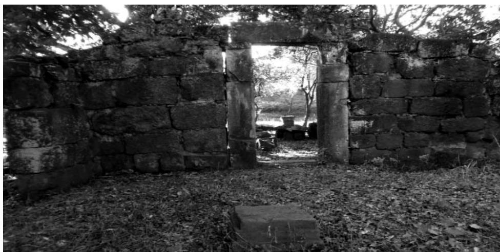
Figura 8. Estructura original de la antigua reducción, ubicada en la parte de atrás del antiguo cabildo.

Se destaca el hecho de que los habitantes de Concepción de la Sierra no sólo sienten comodidad y seguridad en el escenario natural que conforma dicho espacio, sino que también,