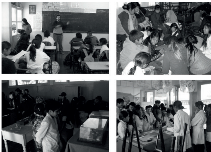
Figura 2: Actividades realizadas con alumnos de sexto y séptimo año de la escuela Lindor Castillo durante 2011.

2° ETAPA: Consistió en la incorporación de la comunidad de La Arboleda fuera del ámbito propiamente escolar a través de algunos de sus representantes (informantes). En este sentido, se llevó a cabo un registro sistemático de entrevistas realizadas a estos referentes, en las que se indagó sobre sus saberes en relación a la historia local (formas y espacios de