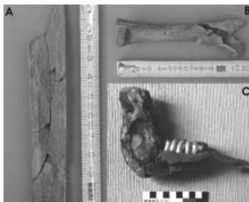
Figura 4. (A) Fractura helicoidal; (B) hueso de cría de guanaco ( Lama guanicoe ) y mandíbula de guanaco ( Lama guanicoe ).

2005). Este elemento se pudo identificar luego de su remontaje y de no haber sido así habría quedado clasificado a nivel de orden en la categoría taxonómica de Carnivora. Por otra parte, la consolidación y remontaje de mandíbulas y de huesos largos de guanaco ( Lama guanicoe ) permitió determinar el rango de edad de estos camélidos y detectar la presencia de crías de guanaco (Kaufmann 2003; Bonomo 2005) (Figura 4). Esto permitió establecer que las ocupaciones del sitio ocurrieron en torno a la estación estival e interpretar que los grupos de guanacos cazados en NMI eran grupos familiares. Por último, a partir del remontaje de fragmentos de huesos largos se pudo establecer la presencia de desechos de fracturas