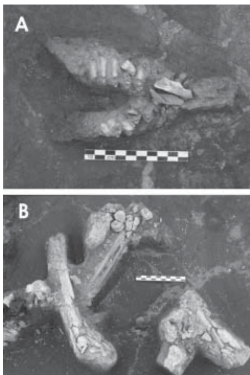
Figura 1. Fragmentación ósea en el sitio Nutria Mansa 1. (A) Mandíbula de guanaco ( Lama guanicoe ) y (B) huesos largos de Camelidae.

diversos sitios arqueológicos (Paso Otero 5, Campo Laborde, Quequén Salado I, Nutria Mansa I, entre otros) en las tareas de conservación de restos óseos. Peretti y Baxevanis (2004) plantean una serie de pasos metodológicos para el tratamiento de los materiales arqueológicos. Estos autores mencionan que la conservación comienza durante los trabajos de campo, continúa en el laboratorio y finaliza en el depósito de colecciones. Ponen especial énfasis en la conservación in situ de los materiales óseos, es decir, durante los trabajos de campo. Esto se debe a que cuanto antes se comience con el tratamiento, menos información se perderá con el procesamiento y estudio de los restos faunísticos. Los pasos de la conservación in situ son los siguientes: limpieza y consolidación del material (estabilización del material por medio