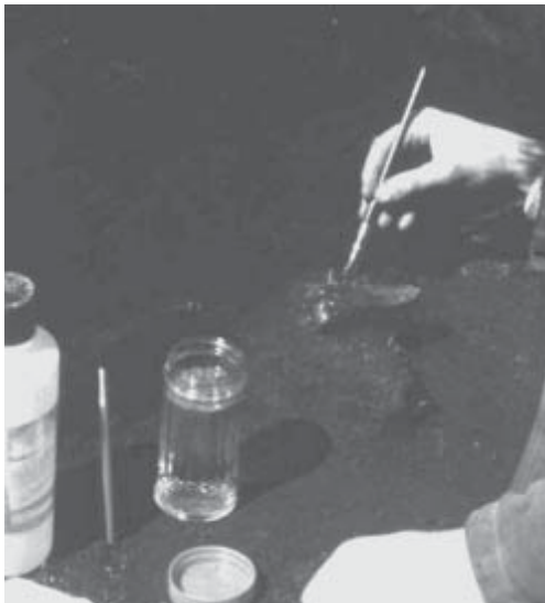
Figura 2. Procedimientos en el campo. Limpieza de un metapodio distal de Camelidae con acetona.

El segundo procedimiento se realizó sobre restos óseos que estaban en mejores condiciones y más completos. Estos especímenes no fueron consolidados con PVAC sino que se los dejó en bloque con el sedimento adherido, actuando el mismo como contenedor, para luego ser embalados con