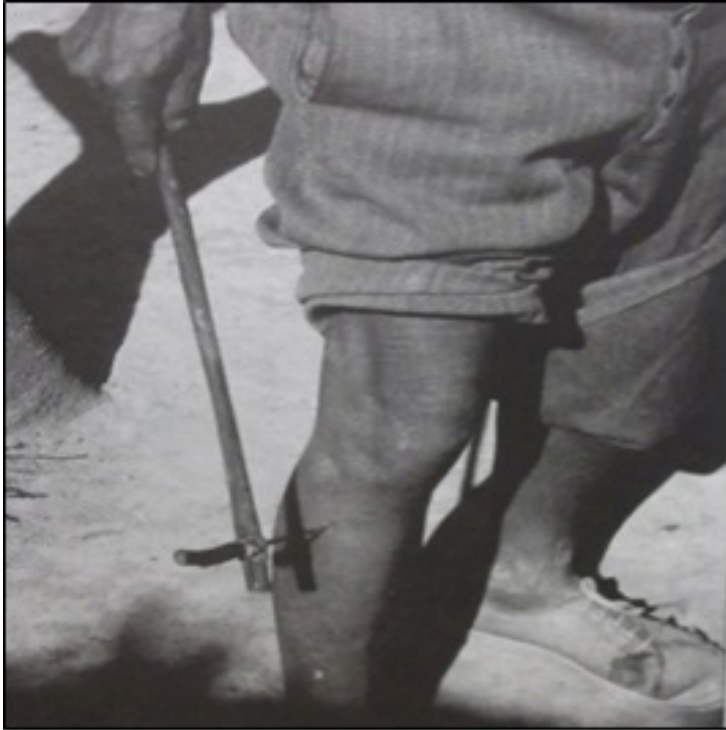
FIGURA 6. Escarificador Toba (Arenas &amp; Porini, 2009).