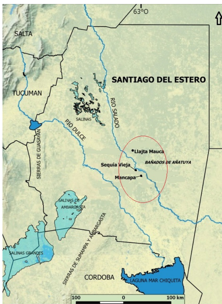
FIGURA 1. Área de estudio: sector del Río Salado medio y ubicación de sitios mencionados en el texto (modificado de Taboada [2019]). Mapa original realizado por Ernesto Rodríguez Lascano.

En lo que refiere al área de estudio, nos centramos en la zona centro sur de la Llanura santiagueña, más precisamente a la altura del actual curso medio del río Salado. Este sector, que se enmarca en el ambiente del Chaco semiárido (Torrella & Adámoli, 2006), se caracteriza por la presencia de esteros, meandros y bañados, como los de Añatuya, favorecidos por la poca