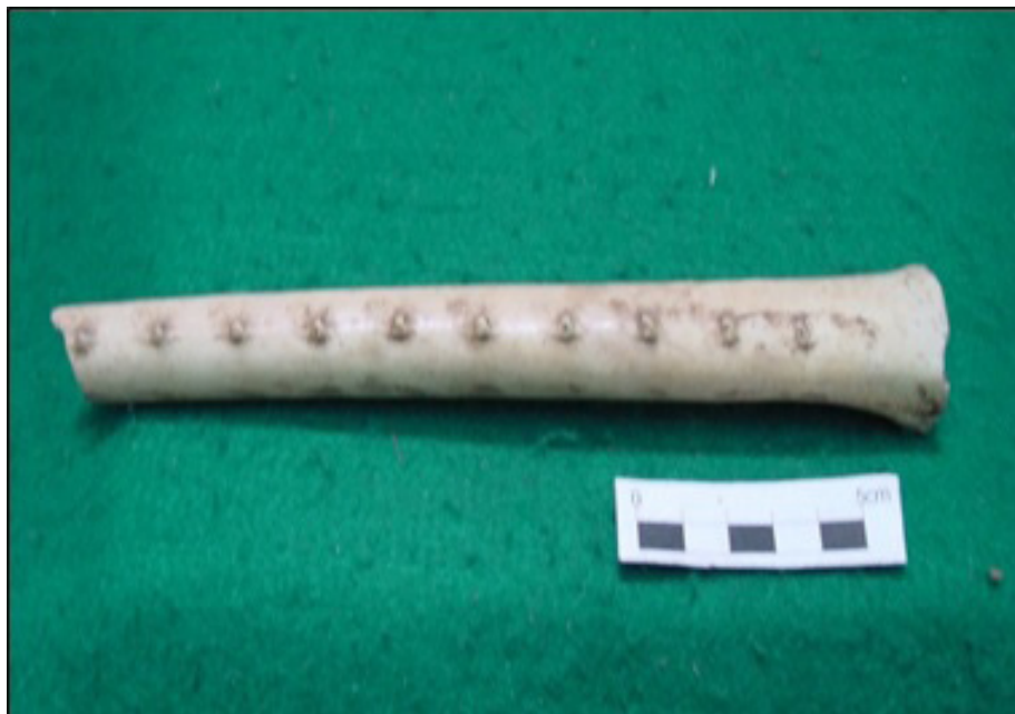
FIGURA 3. Aerófono óseo etnográfico (Chaco salteño) sin datos de asociación cultural, perteneciente a la Colección Palavecino 1940.

Por su parte, también las fuentes etnográficas consultadas mencionan el uso de instrumentos musicales óseos para contextos de ritualidad. Por ejemplo: