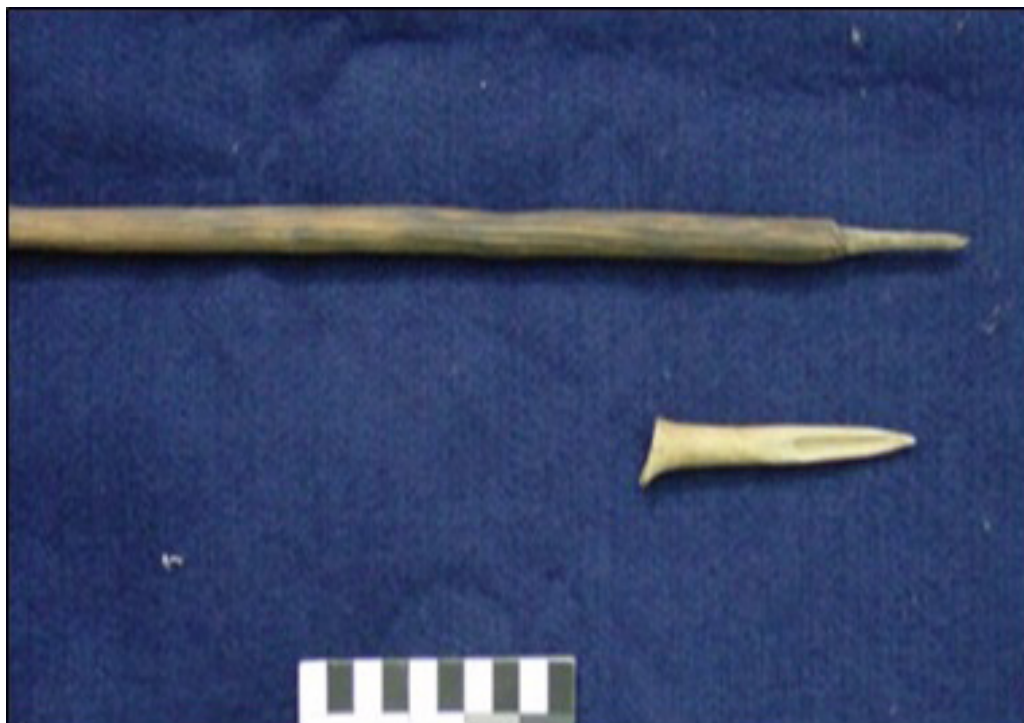
FIGURA 5. Astil de madera y punta ósea Kayapo (Figura tomada de la base de datos digital de la CE-IAM, IAM-M.E.1697).

Por último, otro caso que seleccionamos a modo de ejemplo de aplicación de la metodología propuesta refiere al uso de escarificadores. Las fuentes etnográficas señalan escarificadores realizados con huesos de pescado entre los abipones (Dobrizhoffer, 1968 [1783]), y entre los toba del oeste de Formosa con fíbula de suri o gato del monte (Arenas & Porini, 2009) (Figura 6). Con respecto a posibles similitudes con los bienes arqueológicos de la llanura santiagueña, encontramos reseñas sobre objetos óseos de “puntas muy agudas” (Reichlen, 1940) y también realizados con “astilla de hueso largo en uno de cuyos extremos se ha