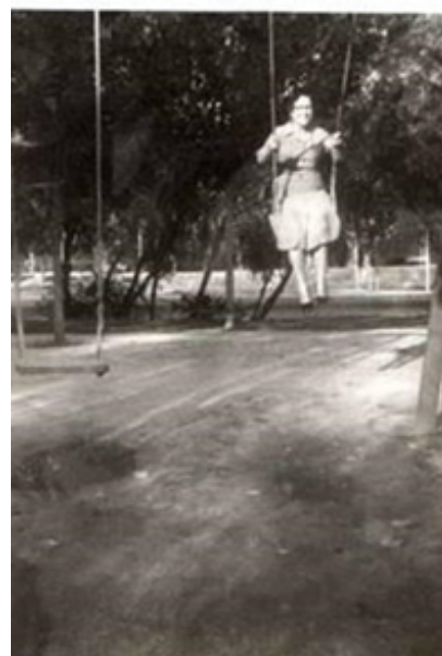
Figura 4 y 5

Fotografías superiores. Rastro de Madrid. Fotografía documental del lugar, 2016.