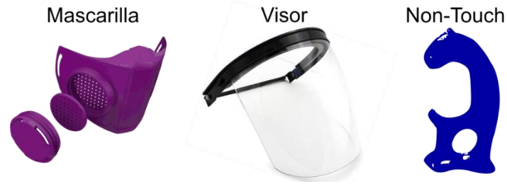
Figura 1. Algunos equipos de protección contra el COVID-19 de impresión 3D.

En este documento se describe un caso de implementación de visores de protección facial usando impresión 3D, para esto se describe el método, los resultados, y se presentan las discusiones y conclusiones.