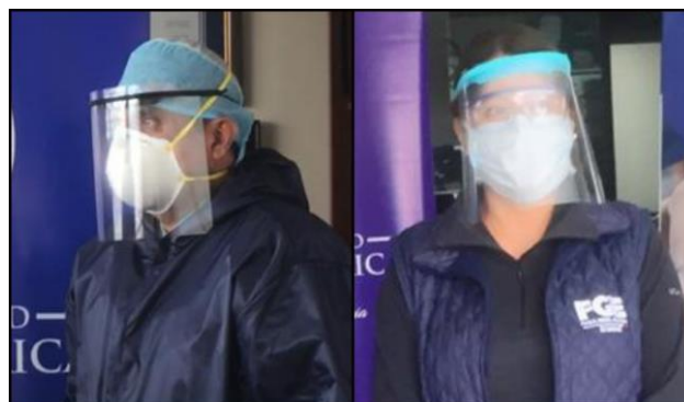
Figura 3. Beneficiarios usando los visores de protección facial

Las entidades beneficiadas hicieron uso de estos implementos previniendo el contagio de médicos y policías de la provincia de Tungurahua (Ecuador). La figura 3 presenta imágenes de los beneficiarios haciendo uso de los visores de protección facial.