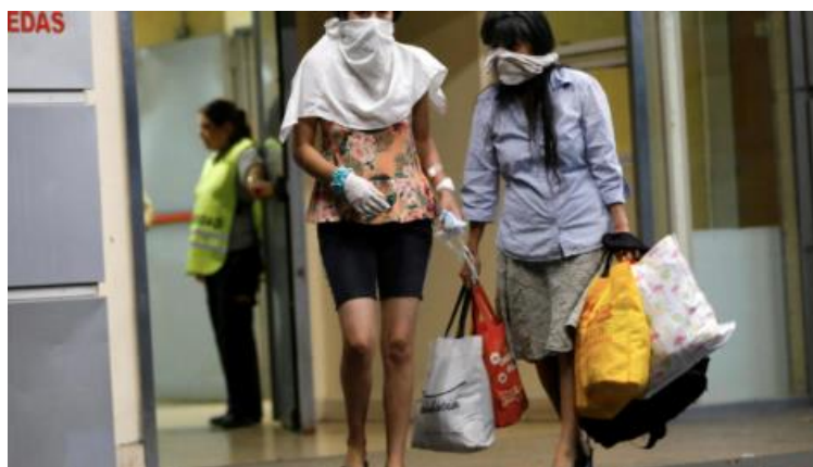
Figura 2. Representación gráfica del género en relación al COVID-19 [11]

En este punto se plantean algunas interrogantes: ¿Cómo se manifestará la desigualdad de género bajo estas condiciones de aislamiento a causa del COVID-19?, (Fig. 2) ¿Afectará de la misma forma a hombres y mujeres?, ¿La expresión de la sexualidad será la misma? [10].