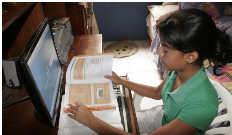
Figura 3: Coronavirus: Sin computadora e internet la educación virtual se complica [10].