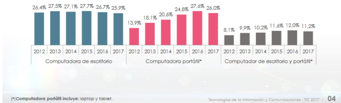
Figura 4: Equipamiento Tecnológico [15].

En el 2017 se incrementó en 12,1 puntos el equipamiento de computadoras portátiles en los hogares, con respecto al 2012.