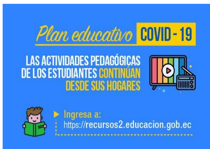
Figura 2: Plan Educativo [7].

Basado en datos del Instituto Nacional de Estadística y Censos (INEC), Freddy Carrión defensor del pueblo, refirió que el 37,23% de los hogares cuenta con un computador a escala nacional y que en el área rural el porcentaje es inferior (23.27%), donde se determina que los estudiantes no todos tienen acceso a un recurso tecnológico, para poder acceder a este nuevo mecanismo que plantea el ministerio de educación [8].