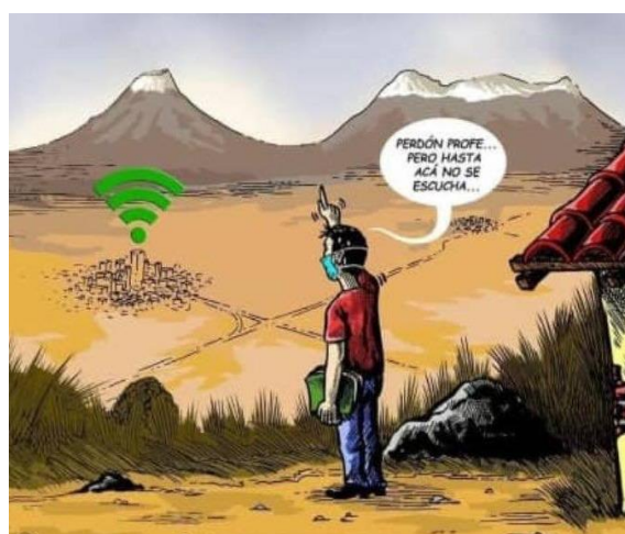
Figura 1: Educación en casa [5].

nacional agrava las desigualdades en la educación y afecta de manera desproporcionada a los niños y jóvenes más vulnerables de nuestro país (fig. 1), de acuerdo con las diferentes declaraciones emitidas por los encargados de la educación se determina que están buscando estrategias, para llegar a los lugares más remotos del país por medio de televisión, radio y boletines impresos [5].