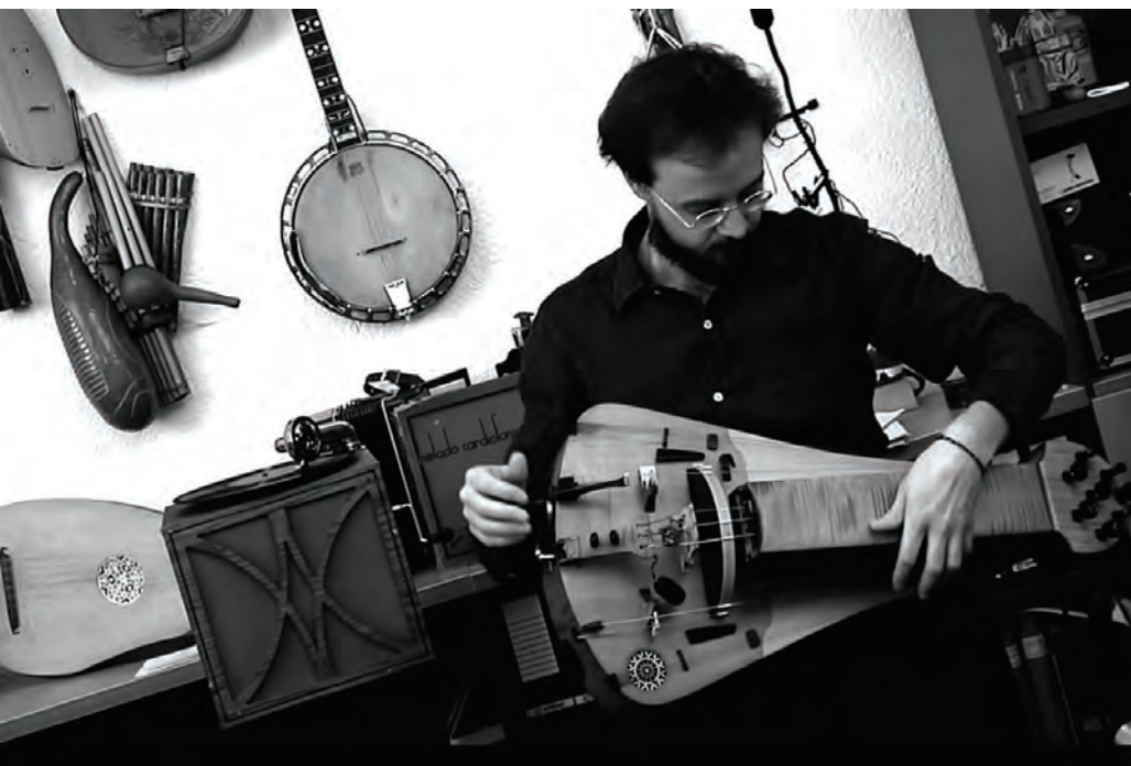
Germán Díaz, fotogramas de su vídeo Método cardiofónico