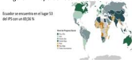
Figura 1. Mapa de resultados del IPS 2017