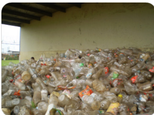
Imagen No1. Plásticos utilizados en el Programa Eco Sólidos