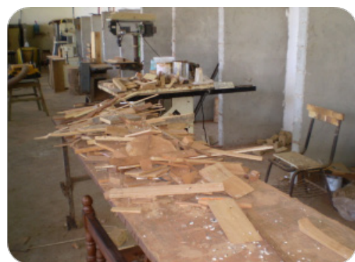
Imagen No2. Programa de Ebanistería Centro Penitenciario La Joyita Centro Penitenciario La Joya