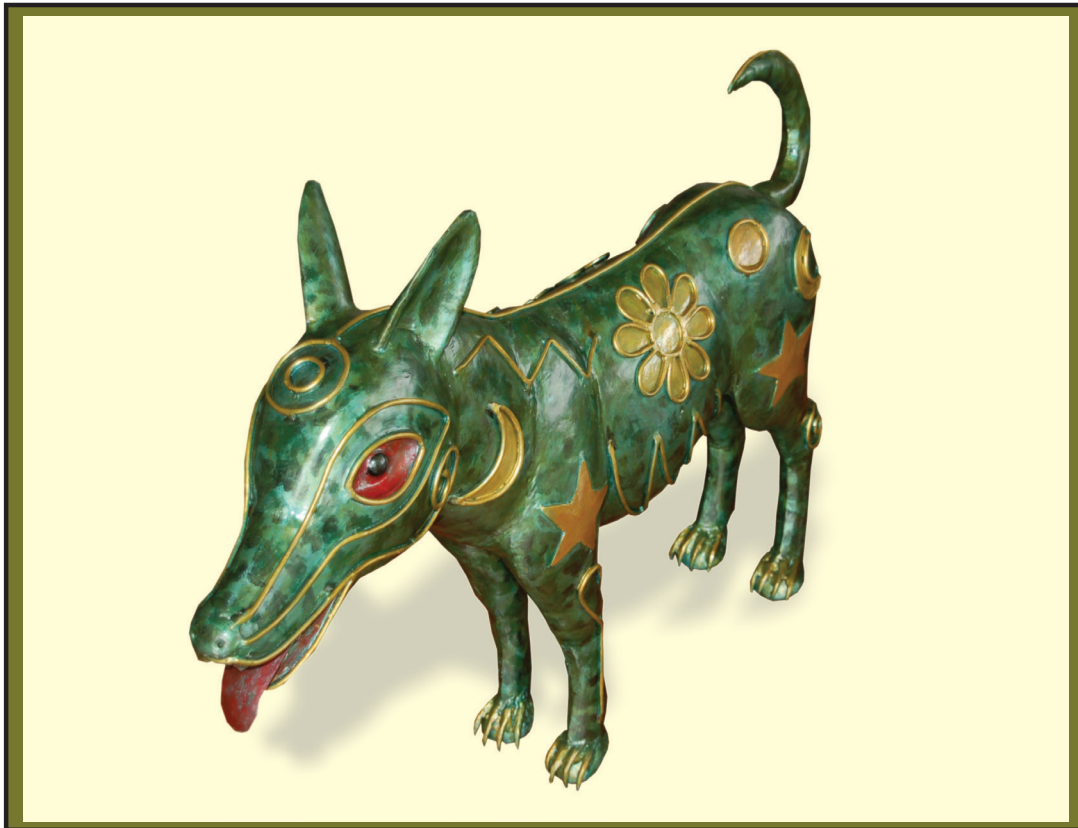
Perro sideral. Hierro y bronce. 2002. Artista plástico peruano, Alberto Quintanilla, (Cusco, 1934).