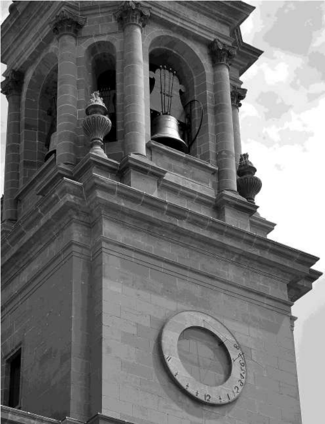
Campana Gabriela sobre el reloj de sol declinante, con un volante de transmisión.

sario, los campaneros de la catedral se percatan de que en la epigrafía tercio de la campana, “entremezclando el francés y el romance con los números romanos” (Isidoro Ursua), la fecha resulta inequívoca “lan mil ccccc et xix et le xxviii iour du mois de iulio”, esto es; “Año mil quinientos y diecinueve y el día veintiocho del mes de julio”.