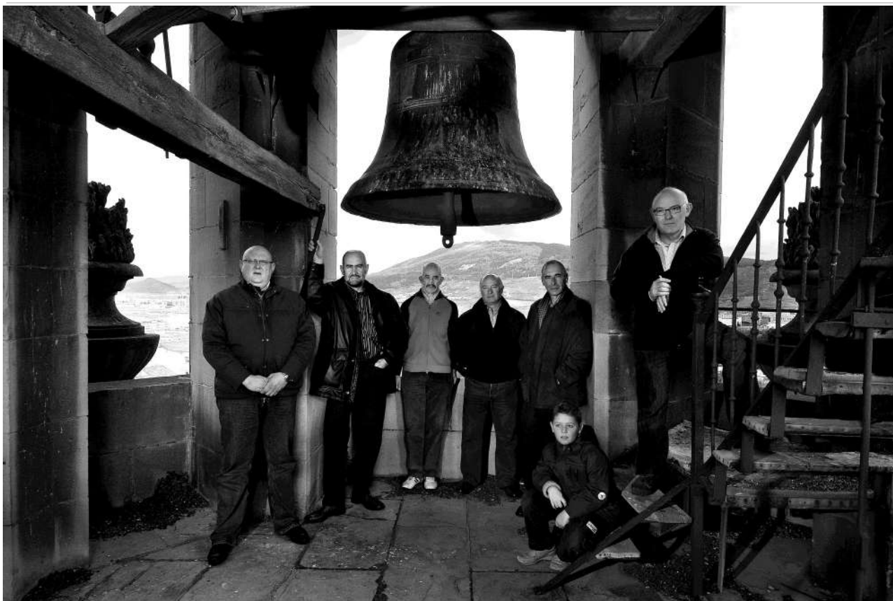
Campaneros de la catedral junto a la Campana Gabriela en la torre norte, 2007.