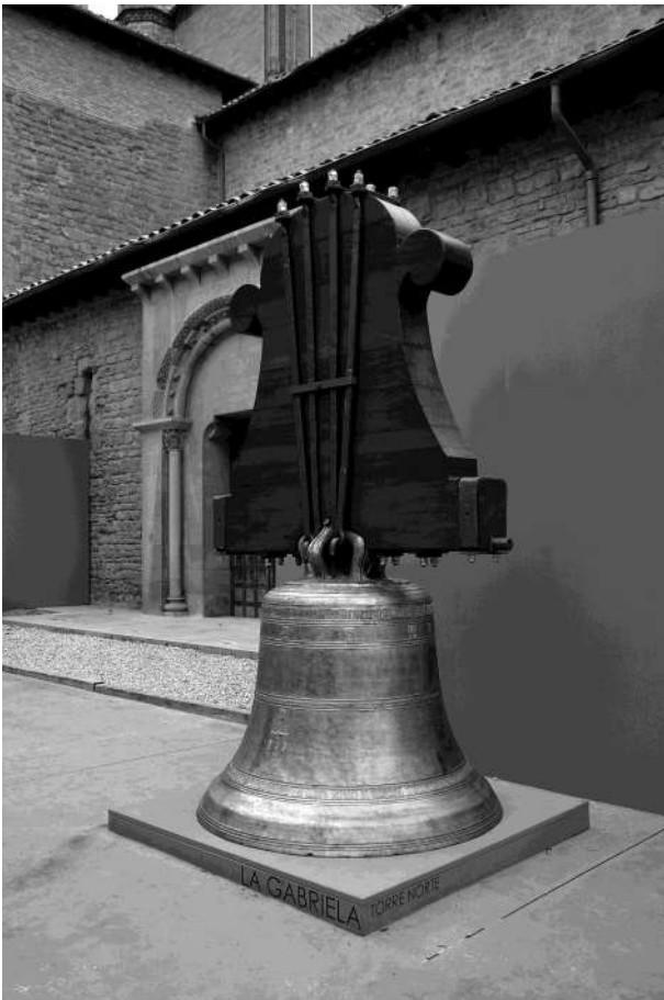
Exposición del arcedianato.