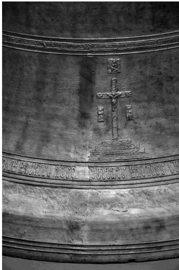
Detalle de la soldadura de la Gabriela.

"La empresa Lachenmeyer actúa desde hace unos 80 años en Alemania, y tuvo su origen en la gran cantidad de campanas rotas existentes tras la I Guerra Mundial, así como las limitaciones económicas del momento, que impedían refundirlas y hacer otras nuevas. La tecnología que aplica Lachenmeyer consiste en el calentamiento global, a más de 400° centígrados y la soldadura mediante soplete aportando material de la misma composición del bronce original. Tras la soldadura se deja enfriar, de manera muy paulatina, reconstruyendo así la estructura del conjunto y recuperando por tanto su capacidad sonora". Después la Gabriela se desplazó a los talleres de la empresa de restauración en Massanassa (Comunitat Valenciana), donde se limpió por dentro y por fuera para recuperar la sonoridad original. Esta limpieza era imprescindible tras la soldadura. Y se le hizo un yugo nuevo de madera adecuado a su tamaño, tomando como modelo el de la de Oraciones de la catedral de Pamplona, con los herrajes también nuevos y adecuados al baneo automático o manual de la