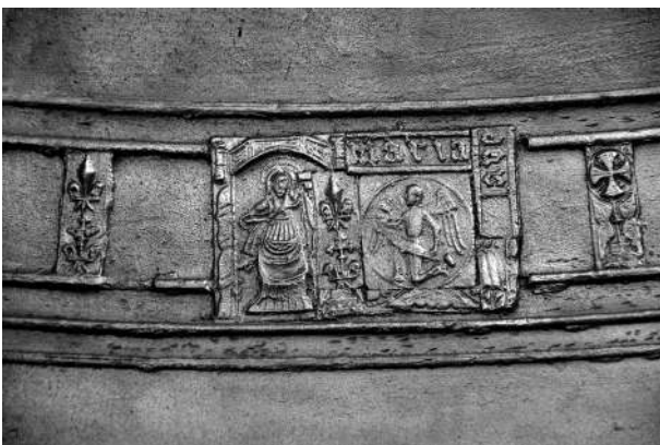
Detalle obtenido en Exposición del arcediano. Catedral de Pamplona (2010-2011).

En 2001 al amparo de la asociación de Amigos de la Catedral se creó un grupo de personas interesadas en recuperar los toques manuales de las campanas de la catedral, reducidos en 1979 tras la electrificación de