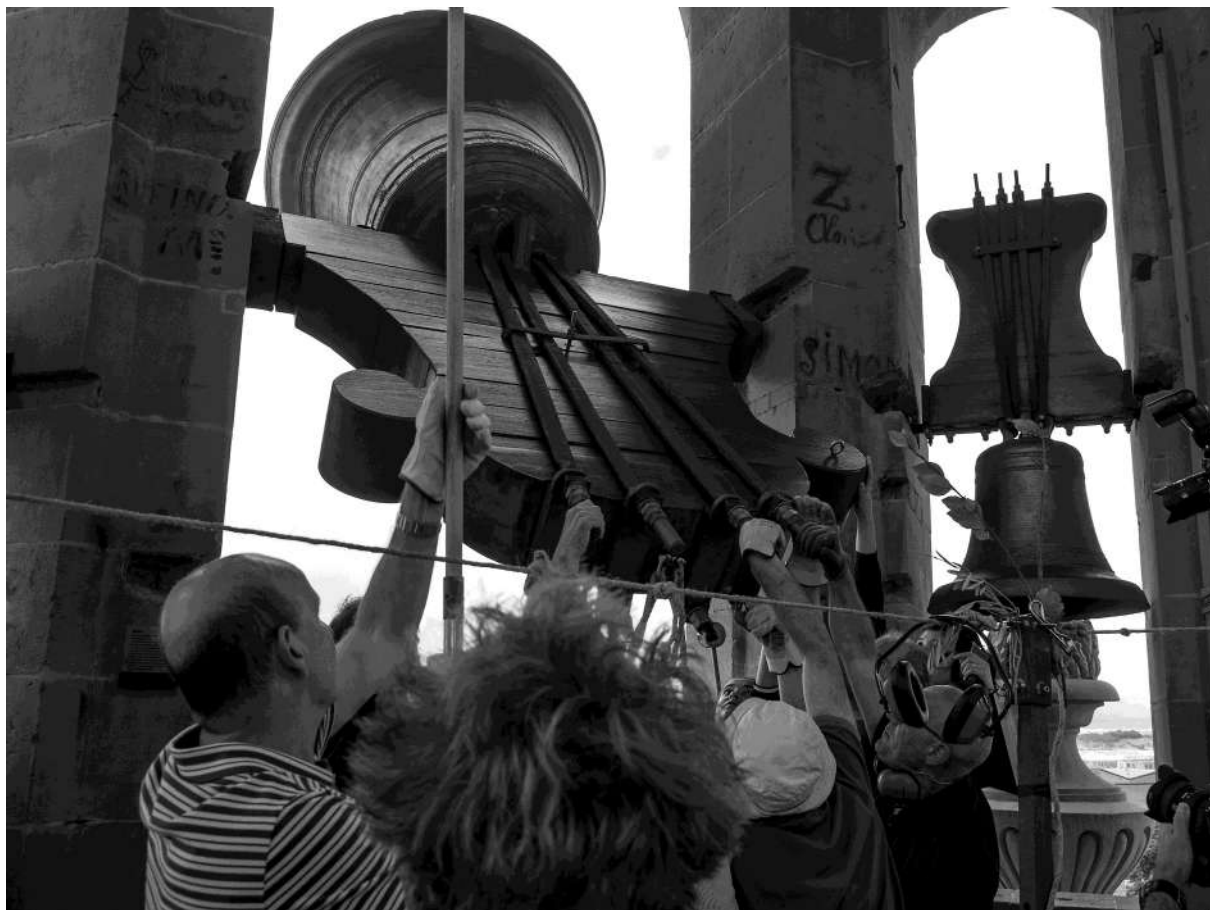
Campaneros de la Catedral empinando la Gabriela, 28 de julio de 2019.

La campana del Reloj muy parecida en dimensiones, pasa al vano que ocupaba la Gabriela, dejando a la vista la campana María y a sus campaneros cuando la tañen, para lo cual emplean dos maromas, que la convierten como suele bromear Urtasun, uno de sus tañedores, en un instrumento de cuerda. Y de las campanas pequeñas, la de Plata y la de Párvulos, vuelven a Pamplona con yugo de madera. A fecha de hoy la única campana de la Catedral con motor para bandeo automático, es la de Santa Bárbara o de Tormentas.