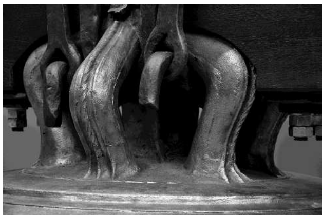
Detalle del yugo y asas de la Gabriela.

La campana del Reloj muy parecida en dimensiones, pasa al vano que ocupaba la Gabriela, dejando a la vista la campana María y a sus campaneros cuando la tañen, para lo cual emplean dos maromas, que la convierten como suele bromear Urtasun, uno de sus tañedores, en un instrumento de cuerda. Y de las campanas pequeñas, la de Plata y la de Párvulos, vuelven a Pamplona con yugo de madera. A fecha de hoy la única campana de la Catedral con motor para bandeo automático, es la de Santa Bárbara o de Tormentas.