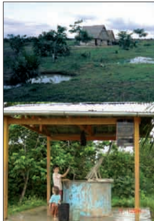
Figuras 1 y 2: Comunidad de Pueblo Libre ubicada en el distrito de Campo Verde (Ucayali, Perú) expuesta a condiciones ambientales predisponentes para Pénfigo Foliáceo Endémico.