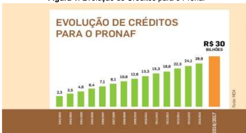
Figura 1: Evolução de Créditos para o Pronaf