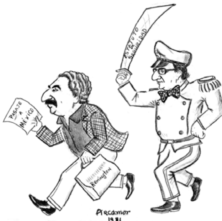
FIGURA 1 | El exilio de Gabriel García Márquez